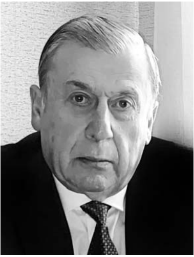
(დასასრული. დასაწყისი „სმ“ N3)

იმის განცხადება, რომ ისინი უდანაშაულოები, თანაც პოლიტიკური პატიმრები არიან, არაფერს ნიშნავს და უსამართლო, უპასუხისმგებლო და უზნეო განცხადებაა. მაშინ რა ვუყოთ ნათურებით გაჩირაღდებულ ღამეში ქვეყნის დასახლად მომხდარ ფაქტებს? ვინ არის დამნაშავე, თუ არა იქ მონაწილე დაპატიმრებული პირები? თვალი დავხუჭოთ და არ დავინახოთ? ან იქნებ, ეს უცხოელანეტელებმა მოაწყვეს და გაფრინდნენ? ასევე, უდანაშაულობასთან ერთად, პოლიტიკატიმრებად მათი გამოცხადება მიუღებელია, მაშინ, როცა წმინდა დანაშაულებრივ ქმედებებთან გვაქვს საქმე და არა პოლიტიკასთან.