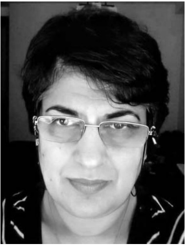
გავხალისდეთ, თან გონებაც გავავარჯიშოთ ქართული ბმპა-შრთან ერთად!