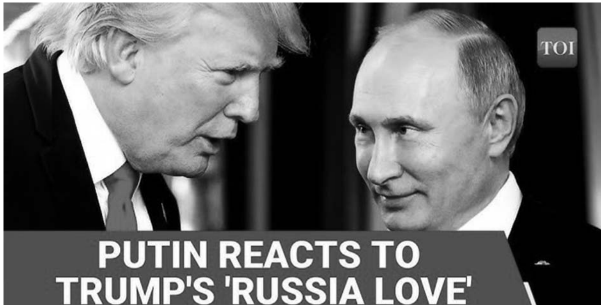
PUTIN REACTS TO TRUMP'S 'RUSSIA LOVE'

გადაუჭარბებლად შეიძლება ითქვას, რომ ამერიკის შეერთებული შტატების 47-ე პრეზიდენტის, დონალდ ტრამპის ოვალურ კაბინეტში მეორედ შესვლამ მსოფლიოში სერიოზული პოლიტიკური რყევები გამოიწვია.