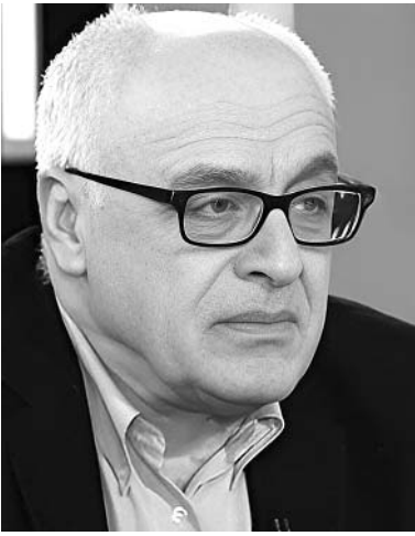
გვესაუბრება ფსიქოლოგი, პოლიტოლოგი რამაზ სამხარაძე

— ბატონო რამაზ, რუსთაველის გამზირზე ქუჩის პროტესტი გრძელდება. როგორც ფსიქოლოგი, როგორ აღწერთ ახალგაზრდების პორტრეტს?