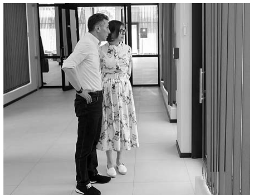
ბატონო ბიძინა, დაბადების დღეს გილოცავთ, 69 წლის ყველა დროის სწორუპოვარ ქველმოქმედ ქართველს, დედა-სამშობლო — დედა-საქართველოში.