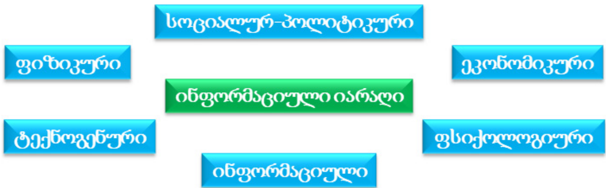
ნახ. 1. სფეროები სადაც ვლინდება ინფორმაციული იარაღით მიყენებული ზიანი

გამოკვლევები უჩვენებს, რომ შედეგიანობის მიხედვით, ინფორმაციულ ომში ინფორმაციული იარაღი მასობრივი განადგურების იარაღის ტოლფასია. მისი მოქმედების სპექტრი ვრცელდება ადამიანების ფსიქიკური ჯანმრთელობისთვის ზიანის მიყენებიდან, კომპიუტერულ ქსელში ვირუსების შეყვანასა და ინფორმაციის განადგურებამდე. ინფორმაციული იარაღი აზიანებს ადამიანის ცნობიერებას, არღვევს პიროვნების იდენტიფიკაციის გზებს და ფორმებს, გარდაქმნის ინდივიდის მეხსიერების მატრიცას, აყალიბებს პიროვნებას წინასწარ მოცემული პარამეტრებით (ცნობიერების ტიპი, ხელოვნური მოთხოვნები, თვითგამორკვევის გზები და ა. შ.), რომლებიც აკმაყოფილებენ აგრესორის მოთხოვნებს, მწყობრიდან გამოჰყავთ სახელმწიფოს და შეიარაღებული ძალების მართვის სისტემები. მისი მიზანია, მოწინააღმდეგის ცოდნასა და წარმოდგენებზე ზემოქმედება, ამასთან ცოდნაში იგულისხმება საყოველთაო ობიექტური ინფორმაცია, ხოლო წარმოდგენებში – სუბიექტური, ინდივიდუალური ხასიათის ინფორმაცია.