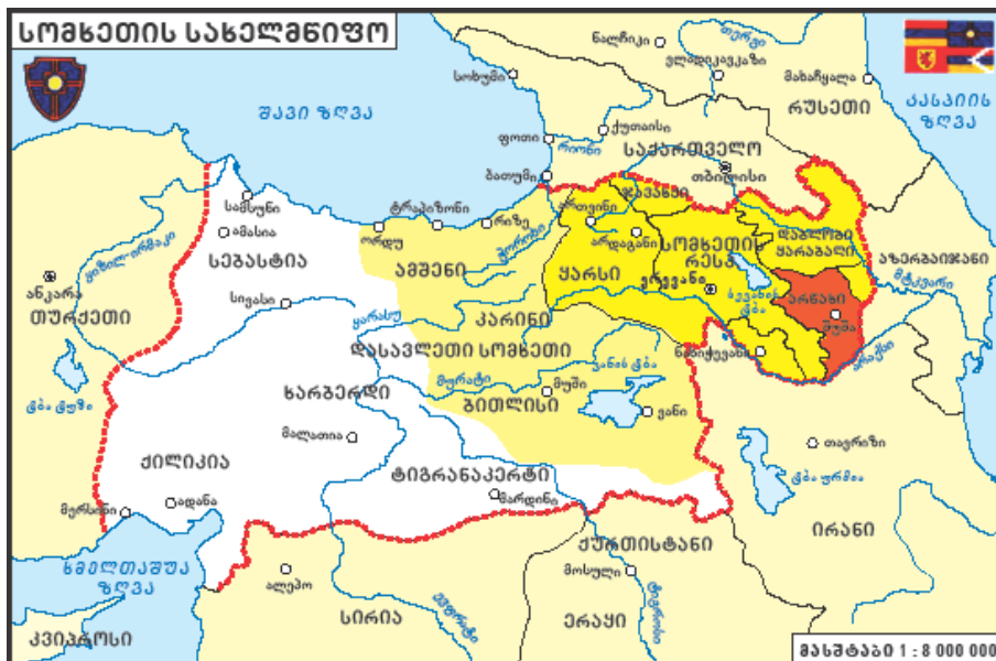
სურ. 2. ილუზორული „სომხეთის სახელმწიფო“ და მისი შემადგენელი ნაწილები - სომხეთის რესპუბლიკა (დღევანდელი სომხეთი), „დასავლეთ სომხეთი“, „არწახი“, „დაბლობი ყარაბაღი“ და „ჯავახი“. ზედა მარცხენა კუთხეში გამოსახულია ამ ე.წ. „სომხეთის სახელმწიფოს“ გერბი, ხოლო მარჯვენა კუთხეში - იგივე „სომხეთის სახელმწიფოს“ დროშა, რომელიც დღევანდელი სომხეთის, ე.წ. „დასავლეთ სომხეთის“, „არწახის“ და ე.წ. „სომხეთის ქილიკიის“ დროშების ერთობლიობას წარმოადგენს.