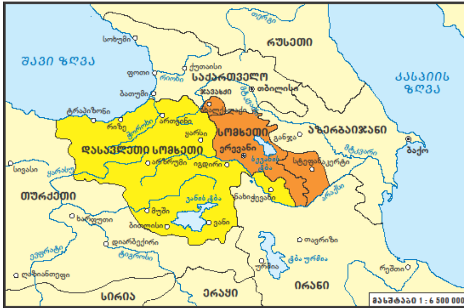
სურ. 3. სომხეთა რევოლუციური ფედერაცია – „დაშნაკცუტიუნის“ მიერ დღეისათვის მოთხოვნილი „გაერთიანებული სომხეთის“ ტერიტორიები. ნარინჯისფერი: ტერიტორიები, სადაც სომხები მოსახლეობის აბსოლუტურ უმრავლესობას წარმოადგენენ (სომხეთის რესპუბლიკა 98%, მთიანი ყარაბაღი 99%, ჯავახეთი 95%). ყვითელი: სომხებით დაუსახლებელი ან ნაკლებად დასახლებული და მათ მიერ მოთხოვნილი ტერიტორიები: ე.წ. „დასავლეთ სომხეთი“ და ნახიჭევანი.

წარმოდგენილი მასალების გაცნობისა და გაანალიზების საფუძველზე სომეხმა ნაციონალისტებმა ამ არარსებული ჰიპოთეზური „სომხეთის სახელმწიფოს“ საზღვრებში, მიუხედავად მისი ისტორიული და სახელმწიფოებრივი კუთვნილებისა, ყველა იმ ტერიტორიისა და ადგილის ჩართვა მოინდომეს, სადაც კი ოდესმე დაედგა სომეხს ფეხი. სომხები ისტორიულად ყოველთვის ადვილად იტანდნენ სხვა ქვეყანაში დასახლებას. მათი ცნობილი დევიზი იყო და ნაწილობრივ დღესაც რჩება: „ვორდედ ჰაც ენდედ გნაც, ენდედ კაც“ (სადაც პურია, იქ გაიქეცი და დასახლდი, იქ გამაგრდიო). 8 ანუ, სადაც თბილი პური ცხვება, იქ არის შენი სამშობლო, - იტყვის სომეხი. ისიც ფაქტია, რომ საუკუნეების მანძილზე უცხო მხარეში მოხვედრილი სომეხობა ცდილობდა გარემოს შეწყობოდა და იგი თავისად ექცია.