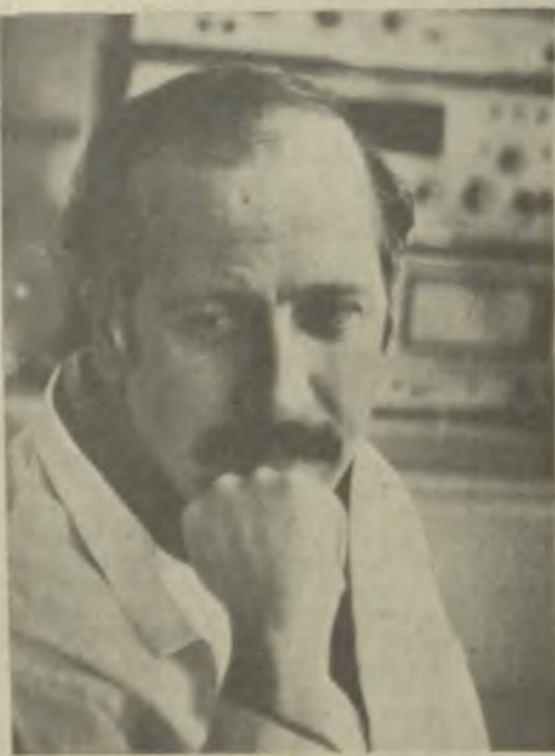
Поздравляем ● Поздравляем ● Поздравляем ● Поздравляем ● Поздравляем ● Поздравляем ● Поздравляем

ний таких высоких результатов во многом способствует внедрение в производство новой техники и прогрессивной технологии, совершенствование организации труда на каждом участке работы.