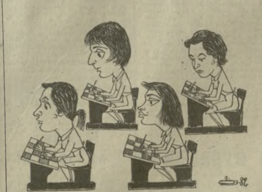
Тбилисская школа шахмат.