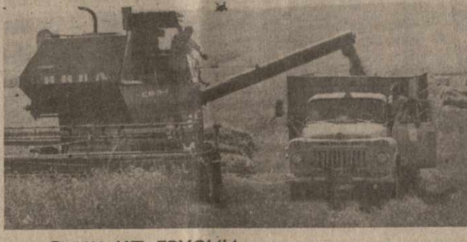
На помощь труженникам Патардеулеского овцеводческого совхоза Сагареджойского района прибыла механизированная бригада...