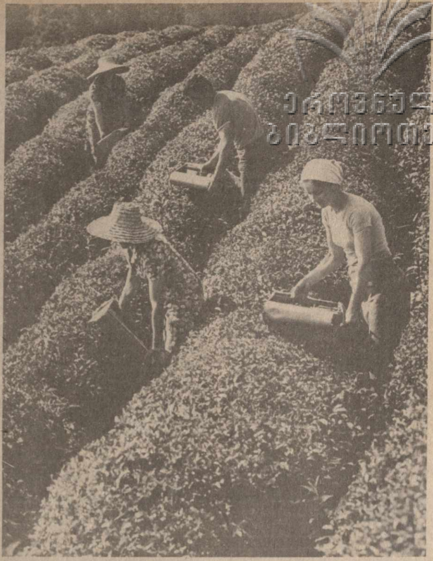
295 тонн сортового чайного листа вместо предусмотренных планом 285 тонн собрали в третьем году одиннадцатой пятилетки члены комсомольско-молодежной бригады № 5 Очамурзского чаеводческого совхоза Кобулетского района...

На заседании Политбюро ЦК КПСС были обсуждены также другие вопросы внутренней и международной жизни.