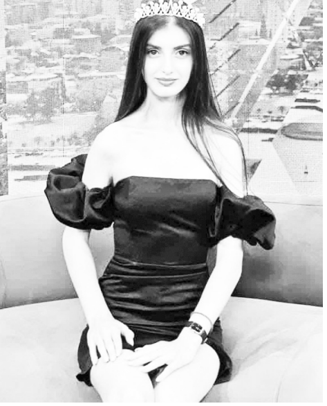
ტალისა“ და „მის ელევანტის“ ნომინაციებში გავიმარჯვე. ეს ამბავი ჩემი უახლესი წარსულის მოგონებებიდან ერთ-ერთი საუკეთესოა.

- 2023 წელს სოციალურ ქსელში საქართველოში სილამაზის კონკურსის შესახებ ვნახე განცხადება. გავგზავნე მონაცემები და მალევე დამიკავშირდნენ. კონკურსი ზაფხულში გაიმართა და მე „მის ინტერკონტინენ-