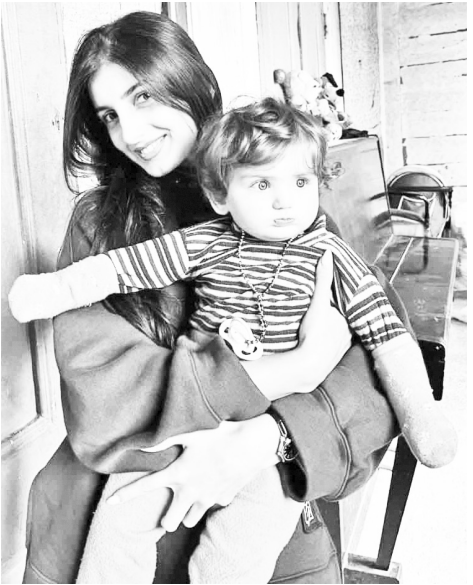
მინტი თქვენი ქვემოქმედების გზაზე?

- 18 წლის ასაკში დავიწყე ქვემოქმედება, წავიდე სამტრედიისში მცირეწლოვან, ობოლ ბავშვებთან. ყველაზე ემოციური მათი ბედნიერი და გაბრწყინებული სახეების დახეხვა იყო. მაშინ მივხვდი, რას ნიშნავდა ჩემთვის ეს საქმიანობა. იმ დღის შემდეგ მოტივაცია მომემატა და მჭერა, კიდევ ბევრი წელი მივცემ ადამიანებს მიზეზს ბედნიერებისთვის.