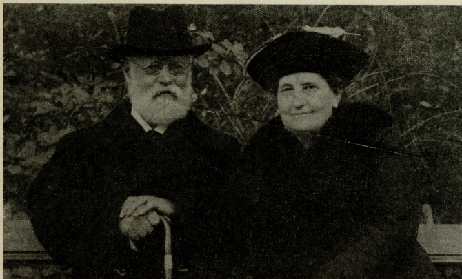
ქარლ კაუცკი და მისი მეუღლე ლუიზა.

დავად მათი დიდი თეორიული მნიშვნელობისა და ხასიათისა, შთაგონებული და ნაკარნახევია შექმნილ მდგომარეობით და მუშათა კლასის ამა თუ იმ ბრძოლის ეპიზოდებით. როცა სოციალისტურ მოძრაობას წინ სავალ გზაზე რაიმე ახალი დაბრკოლება აღმოუჩნდებოდა და ამ დაბრკოლების დასაძლევად ახრთა გაცვლა-გამოცვლა გაიმართებოდა, კაუცკი მუდამ მზად იყო კალამი ხელში აეღო და, ბროშურის, თუ წიგნის სახით, სადაო საკითხი მთელი მისი ავტორიტეტით, ფაქტების ღრმა ცოდნით და გაგებით მკითხველთათვის ნათლად გაერკვია და გაეშუქებია. და უმეტეს შემთხვევებში, თუ ყოველთვის არა, კაუცკის აზრს პრაქტიკულ მუშაობაში ჩამბულთათვის გადამწყვეტი მნიშვნელობა ჰქონდა.