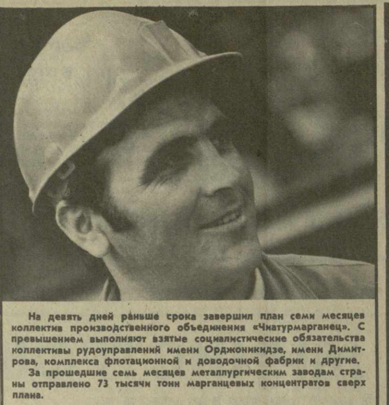
На девять дней раньше срока завершил план семи месяцев коллектив производственного объединения «Чатурмарганец». С превышением выполняются социальные обязательства коллектива руководящих инициативных групп, имени Дмитрия, комплекса флотационной и доводочной фабрик и другие.

Центральный Комитет КП Грузии, Совет Министров Грузинской ССР и Грузинский республиканский совет профсоюзов утвердили план мероприятий по дальнейшему развитию бригадной формы организации и стимулирования труда в народном хозяйстве республики в свете постановлений ЦК КПСС «О дальнейшем развитии и повышении эффективности бригадной формы организации и стимулирования труда в промышленности», наметили меры по дальнейшему улучшению организации этого дела в республике. (ГрузИНФОРМ).