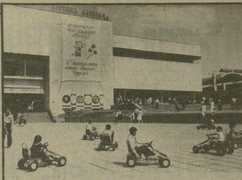
Многолюдно в эти дни в Тбилиском универмаге «Детский мир». Здесь открыта школьная ярмарка. Ученики предлагают большой ассортимент товаров: это канцелярские изделия, школьная одежда. На ярмарке юные посетители ждут увлекательные игры, развлекательные качели, карусели, катинги.