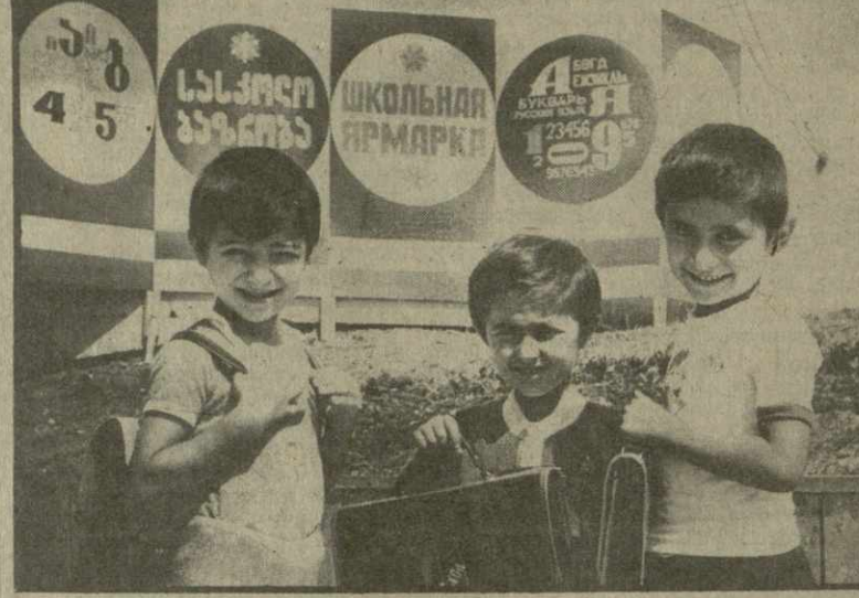
На снимках: сверху — перед зданием универмага «Детский мир»; внизу — эти ребята с первого сентября впервые переступят порог школы.