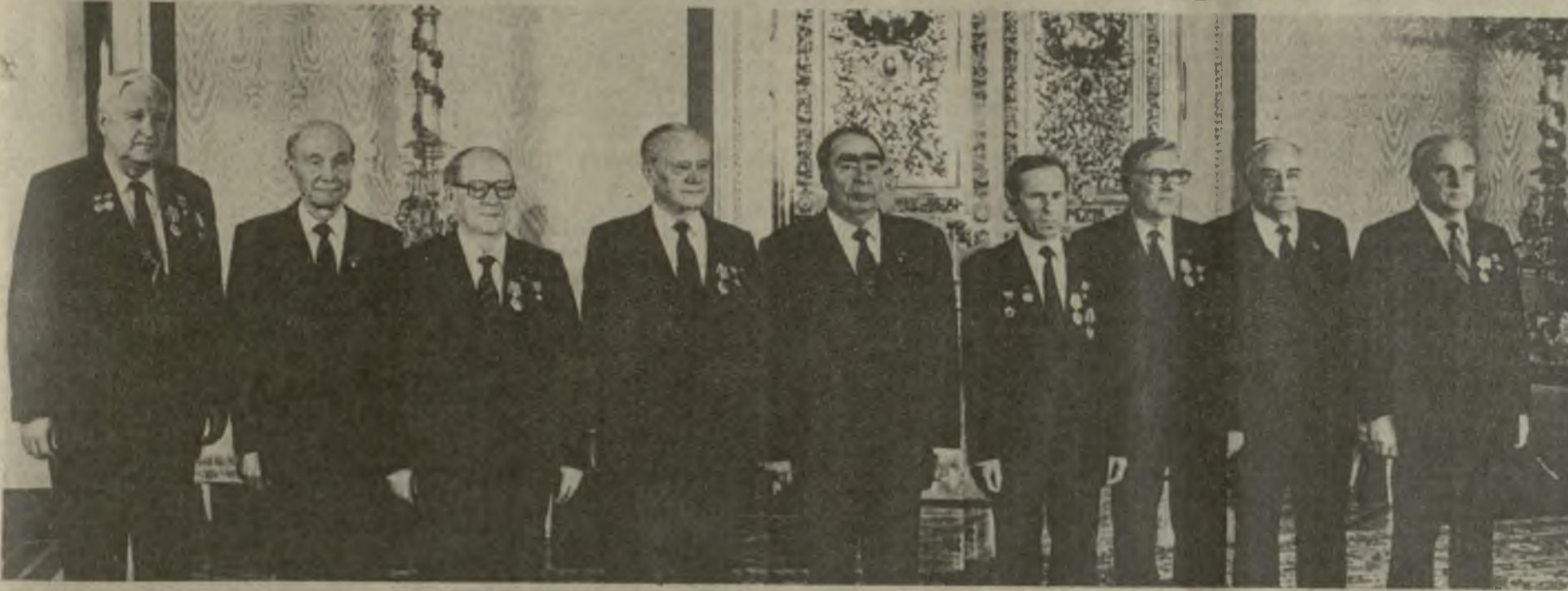
При вручении наград.