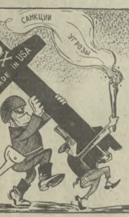
Рис. Эгери Майсрадзе.

Правящие круги Соединенных Штатов Америки разрабатывают политическое, идеологическое и экономическое наступление на социализм, довели до небывалого уровня и интенсивность своих военных приготовлений. Стремясь к достижению американской мировой гегемонии, Вашингтон объявил «крестовый поход» против Советского Союза и других стран социалистического содружества. (Из газет).