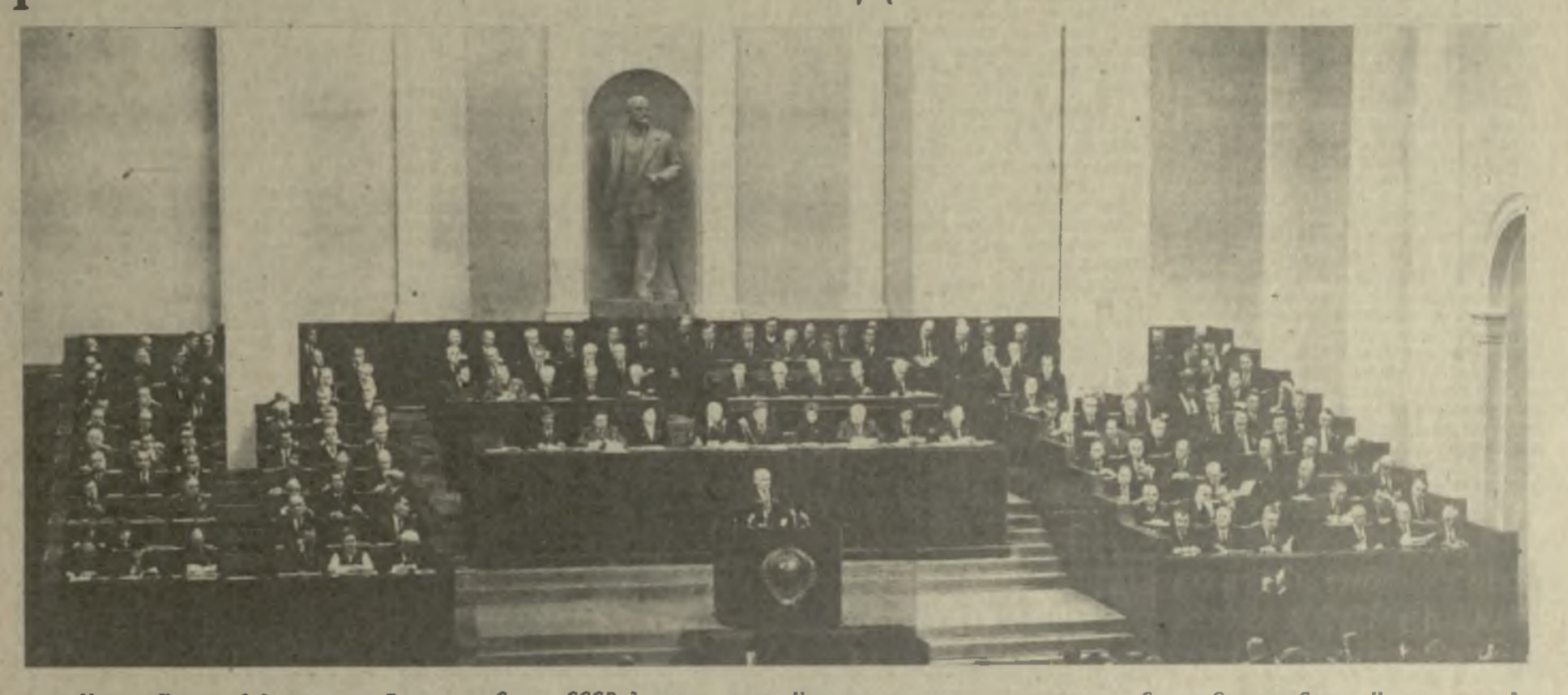
Москва. Кремль. Седьмая сессия Верховного Совета СССР десятого созыва. На снимке: совместное заседание Совета Союза и Совета Национальностей.

Совета Национальностей Верховного Совета поручили мне внести на ваше рассмотрение предложение об избрании Генерального секретаря ЦК КПСС товарища Андропова Юрия Владимировича членом Президиума Верховного Совета СССР. Вся наша партия и весь советский народ знают товарища Ю. В. Андропова как видного деятеля Коммунистической партии и Советского государства, ближайшего соратника Леонида Ильича Брежнева, талантливого организатора и политического руководителя, безависно преданного партии Ленина, великому делу строительства коммунизма. Состоявшийся 12 ноября 1982 года внеочередной пленум ЦК КПСС единодушно избрал товарища Ю. В. Андропова Генеральным секретарем Центрального Комитета Коммунистической партии Советского Союза. Пленум продемонстрировал моно-