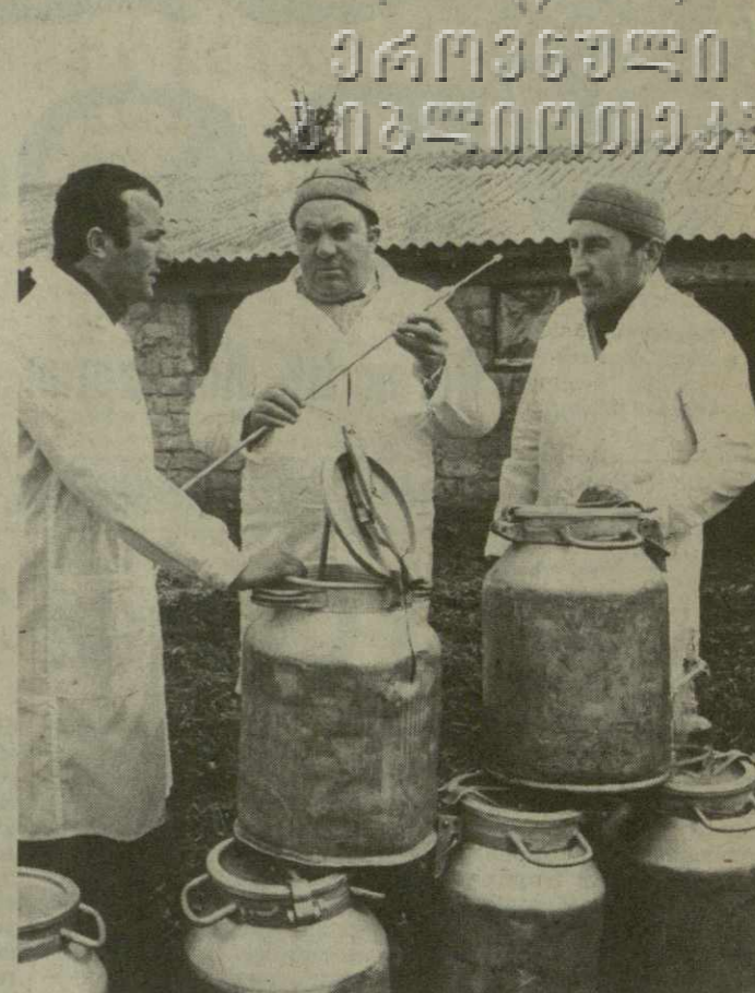
Колхоз имени Руставели села Мукур — передовое хозяйство Чхороцкского района. Больших успехов добиваются в последнее время животноводы. Только в прошлом году они продали государству 1.743 центнера молока, 454 центнера мяса. Эти показатели намного выше плановых.

Развернуто социальное соревнование за достойную встречу XXVII съезда КПСС, животноводы горного хозяйства взяли на завершающий год пятилетки повышенные социальные обязательства. Решено от каждой фуражной коровы надеть по 2.500 килограммов молока — на пятьсот килограммов больше задания. Со значительным превышением будут реализованы государственные задания по поставкам животноводческой продукции.