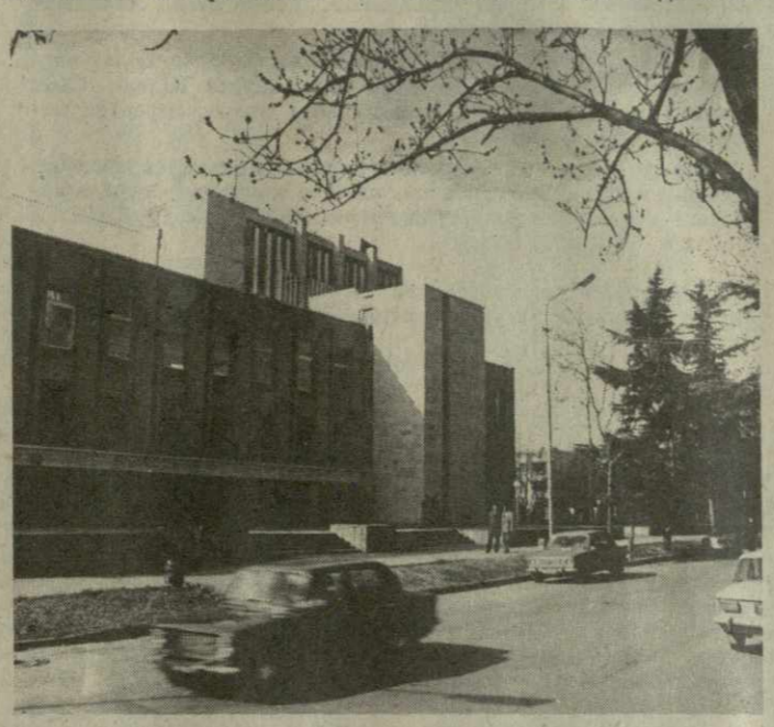
Одна из красивейших магистралей Цхинвали — улица Коста Хетагурова.

предыдущей увеличилась на 11 процентов и достигла 18,7 миллиона рублей. Еще разительнее темпы роста строительного производства. Так, за всю десятилетку в развитие народного хозяйства Юго-Осетии было вложено 104 миллиона рублей, а за четыре года нынешней уже освоено капитальных вложений более чем на 170 миллионов рублей. Построены и введены в эксплуатацию основные фонды общей стоимостью 158 миллионов рублей — почти вдвое больше, чем за всю десятилетку. Только жилья введено около 80 тысяч квадратных метров, что позволило улучшить жилищные условия более 7,5 тысячи трудящихся. Еще большей отдачей, особенно от ввода в действие