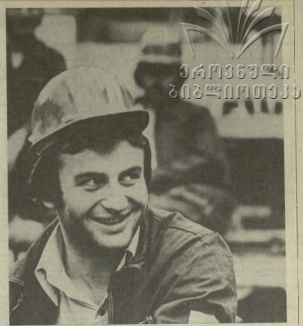
Успешно несут трудовую вахту в честь 60-летия образования СССР коллективы двух отрядов «Тбилисметаллострой», прокладывающие автодорожный тоннель сквозь горы Кавказа, и СУ-839 треста «Севкавдорстрой», ведущего укладку асфальта.

Информация о положении дел будет публиковаться систематически.