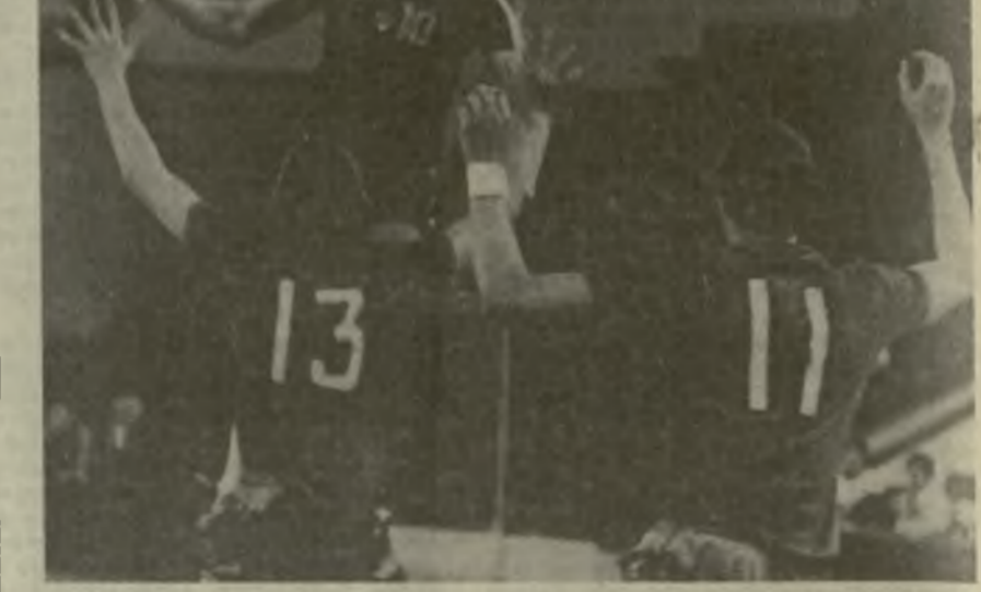
На снимке: один из моментов игры между гандболистами сборной СССР и молодежной СССР.

Заклучала первый день турнира встреча сборных Грузии и Польши. Игра проходила остро и напряженно. Тбилисцы упорно атаковали, особенно в первой половине матча, но так и не сумели переиграть соперников и уступили им в счете — 23:36.