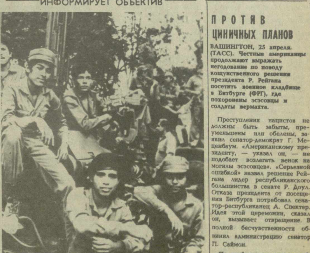
НИКАРАГУА. Перед лицом нарастающей угрозы прямой американской военной интервенции никарагуанцы укрепили свою оборону, готовясь дать решительный отпор империалистической авантюре. На снимке: эти землячки — бойцы США, принимавшие участие в боях с сомосовцами. (ТАСС, 25 апреля).

На снимке: эти землячки — бойцы США, принимавшие участие в боях с сомосовцами. (ТАСС, 25 апреля).