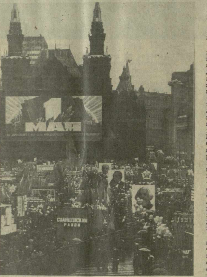
МОСКВА. 1 Мая 1985 г. На снимке: демонстрация трудящихся на Красной площади.

А. ЕРМАКОВА, А. БЕЛКОВ, М. БОРОДИН, Ю. БУЯК, В. КУЛИКОВ, В. ПЕТРУНИ.