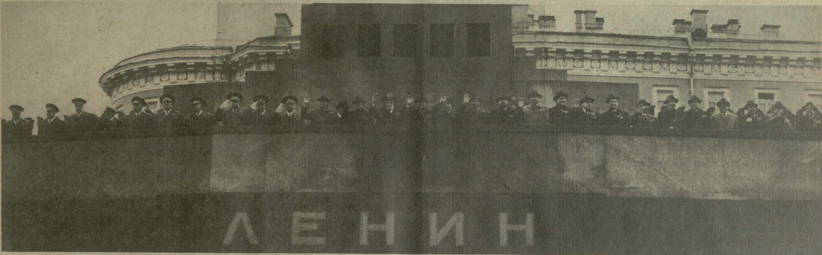
МОСКВА, 1 Мая 1985 г. Демонстрация трудящихся на Красной площади. На снимке: на трибуне Мавзолея В. И. Ленина.