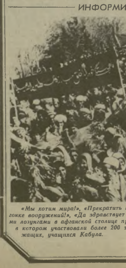
«Мы хотим мира!», «Прекратить вмешательство в дела Афганистана!», «Нет — гонке вооружений!», «Да здравствует международная солидарность!» — под такими лозунгами в афганской столице прошел мир марш, завершившийся митингом, в котором участвовали более 200 тысяч рабочих, крестьян, ремесленников, служащих, учащихся Кабула.

● АККРА. Намерения США и рабистского режима Претории разместить американские крылатые ракеты на территории ЮАР — серьезная угроза безопасности африканских народов, заявил в интервью корреспонденту ТАСС заместитель пре-седателя Общества друзей «Гана — СССР» Укула Соботи. Прогрессивная общественность континента решительно осуждает планы размещения американского ракетного оружия. Эти милитаристские потуги резко увеличивают вероятность вовлечения Африки во всеобщую ядерную войну, подчеркнул У. Соботи. (ТАСС, 23 декабря).