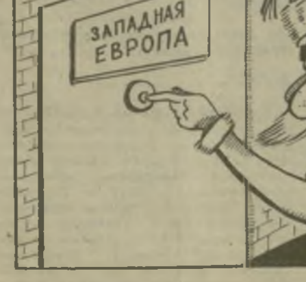
РОЖДЕСТВЕНСКИЕ ПОДАРИКИ АМЕРИКАНСКОГО САНТА КЛАУСА. Рис. Ираклия Иоселиани.

США и их союзники по НАТО не отказываются от размещения на территории стран Западной Европы американского атомного оружия. (Из газет).