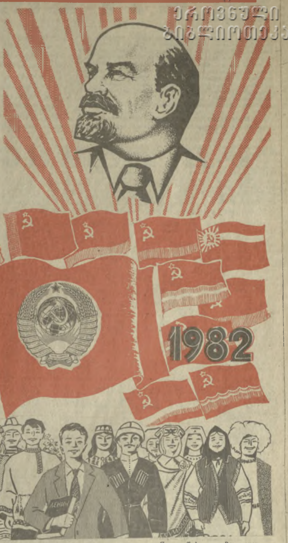
Плакат Теймураза Ратшвили.

საბჭოთაო კავშირის დასახელებულია საბჭოთაო კავშირის სახელსა და საბჭოთაო კავშირის სახელს