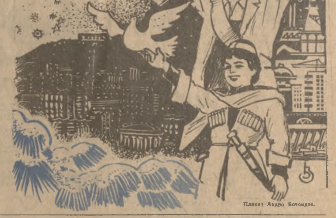
Плакаты Аидро Бочомдзе.