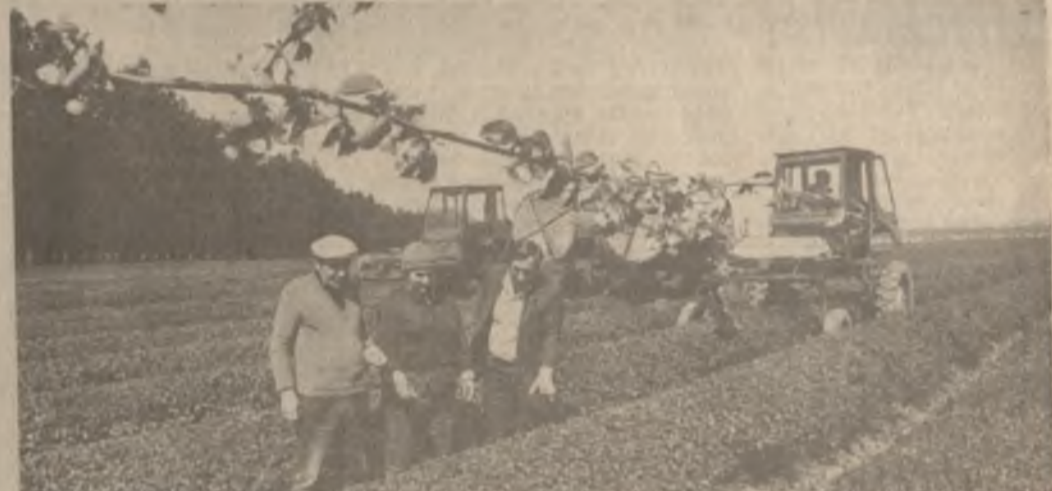
В республике приступили к выборочному сбору чайного листа. Готовятся к старту и труженники Очамуртского чаеводческого совхоза Кобулетского района — одного из старейших субтропических хозяйств Adjara. Они режут в сезоне-86 продать государству 6 тысяч тонн сортового листа. Значительно возрастает удельный вес сырья, собранного с помощью механизмов.

Слово свое он сдержал с честью. В эту трудовую победу весомый вклад внес коллектив модельного цеха. Он добился надежной работы агрегатов, полностью исключил их простои. Ветераны труда здесь охотно передают свой опыт молодежи. В цехе организована школа по изучению их методов труда.