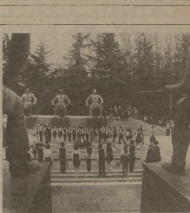
В День памяти многолюдно было в парке «Победы». На снимке: у могилы Неизвестного солдата.