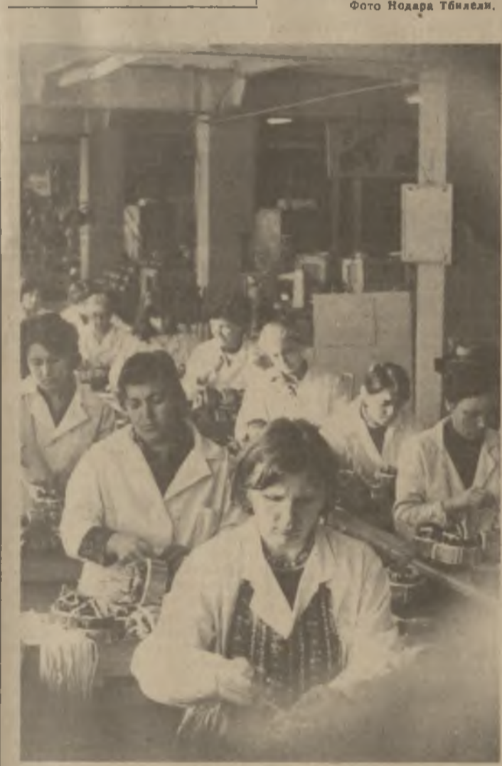
◆ ГАЗЕТА ВЫСТУПИЛА. ЧТО СДЕЛАНО?