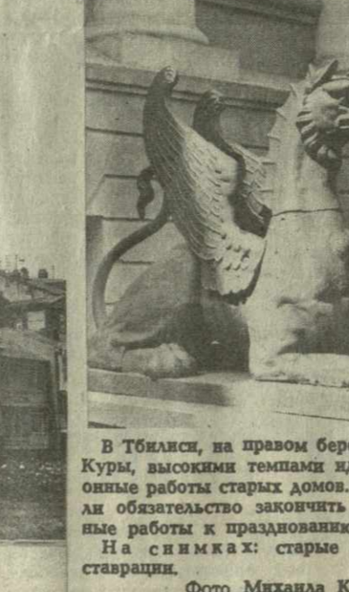
В Тбилиси, на правом берегу набережной Куры, высокими темпами идут реставрационные работы старых домов. Строители взяли обязательство закончить все строительные работы к празднованию Тбилисобою. На снимках: старые дома после реставрации.