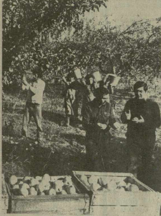
На дворе — ноябрь, походит к концу осень, а в яблоневых садах идет сбор урожая поздних сортов. Козок имени Сталина села Квемо-Чапа Каспского района в этом году урожай государству на менее 1.700 тонн плодов. Значительная часть из них отправляется во многие промышленные центры республики и страны.