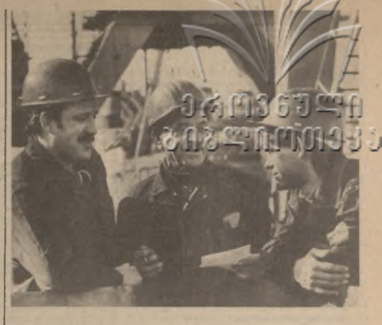
На ставлея Потийского судоремонтно-судостроительного завода имени С. Орджоникидзе начались строительные работы по сборке судна третьего поколения кораблей на подводных крыльях — «Альбатрос».

№ 120 (18475) СУББОТА, 24 МАЯ 1986 ГОДА ЦЕНА 3 КОП.