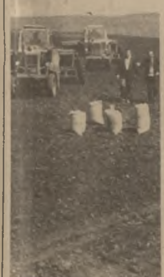
Сев кукурузы завершили механизаторы Мухравского животноводческого совхоза Мидхетского района. Под эту культуру в хозяйстве отведено 368 гектаров. Углубляя, что еще ранней весной в совхозе кормовыми культурами — овсом, люцерной, эспардетом — было занято около 900 гектаров, можно с уверенностью говорить, что фермы совхоза будут обеспечены кормами до июля. На снимке: на весеннем поле в Мухравии.