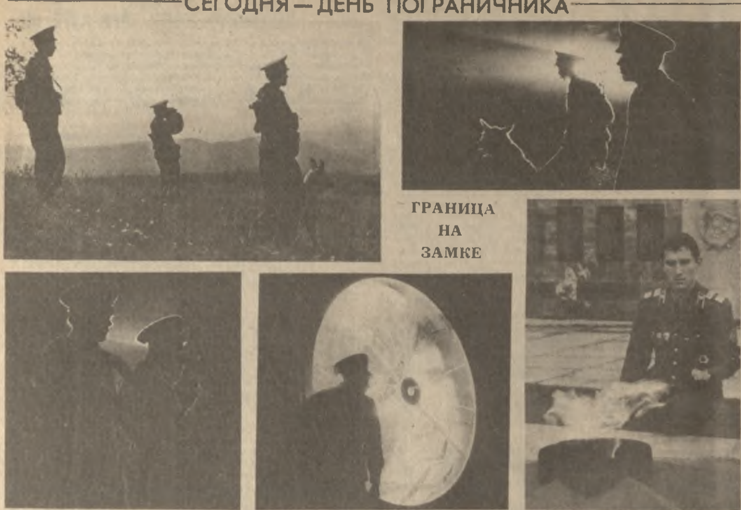
ГРАНИЦА НА ЗАМКЕ