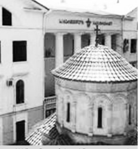
„აგერს“ თანადგომისთვის - გკითხულობთ განცხადებაში.

დასავლეთ საქართველოში დიდთოვლობამ ჩვენი ხალხისა და ზოგადად, ქვეყნისთვის მიძიმე შედეგები მოიტანა. სამწუხაროდ, არის მსხვერპლიც. ხელისუფლება, სამაშველო სამსახურები და მოხალისეები. ყველა ცდილობს, შეეწიოს სტიქიის ზონაში მოხვედრილთ. სრულიად საქართველოს კათოლიკოს-პატრიარქის, უწმინდესისა და უნეტარესის ილია II-ის გადაწყვეტილებით, საქართველოს საპატრიარქოდან დაზარალებულთათვის გაიგზავნება საკვები პროდუქტი, ტანსაცმელი, მედიკამენტები, თბილი გადასაფარებლები და სხვ. ღმერთმა დალოცოს სტიქიის ზონაში მყოფნი, ღმერთმა დალოცოს სრულიად საქართველო და დაიფაროს განსაცდელთაგან. მადლობა საქველმოქმედო ფონდ