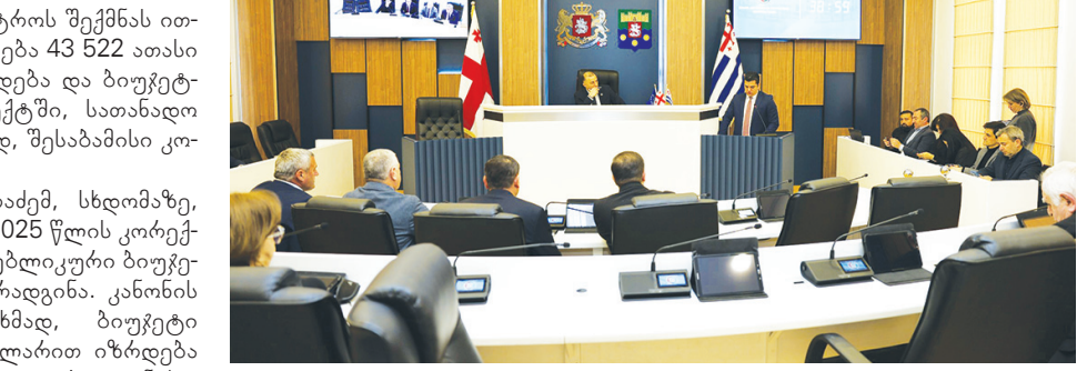
მიკის სამინისტროს ბიუჯეტი. 23%-იანი მატება აქვს კანონმდებლობისა და სოციალური დაცვის სამინისტროს - უწყების ბიუჯეტი 80 მილიონ ლარს აჭარბებს, ხოლო სოფლის მეურნეობის სამინისტროს ბიუჯეტში, რომელიც 36 მილიონ 820 ათასი ლარია, მუხლობრივი ცვლილებებია. გაზრდილია განათლებისა და სპორტის სამინისტროს ბიუჯეტი, რომელიც 117 მილიონ ლარს აჭარბებს. მომხსენებლის განცხადებით, ის მასივან.

აღნიშნეს, რომ რთული მეტეოროლოგიური პირობების მიუხედავად, ყველა სამსახური ორიენტირებულია მოსახლეობის მდგომარეობის შემსუბუქებაზე. დღის წესრიგით გათვალისწინებული საკითხები, სხდომაზე, ფინანსთა და ეკონომიკის მინისტრმა ჯაბა ფუტყარაძემ წარადგინა. კანონმდებლებმა, გამარტივებული წესით (ერთი მოსმენით), განიხილეს და მცირე ტექნიკური შენიშვნის გათვალისწინებით მიიღეს: „აჭარის ავტონომიური რესპუბლიკის მთავრობის სტრუქტურის, უფლებამოსილებისა და საქმიანობის წესის შესახებ“ და „აჭარის ავტონომიური რესპუბლიკაში განათლების ხელშეწყობის შესახებ“ კანონებში შესატანი ცვლილებების პროექტები. ჯაბა ფუტყარაძის განცხადებით, კანონპროექტები განათლების, კულტურისა და სპორტის სამინისტროს რეორგანიზაციის შედეგად, ახალი, კულტურის სამინისტროს შექმნას ითვალისწინებს. უწყება 43 522 ათასი ლარით დაფინანსდება და ბიუჯეტის კანონის პროექტში, სათანადო ჩანაწერთან ერთად, შესაბამისი კოდექსი გაჩნდა. ჯაბა ფუტყარაძემ, სხდომაზე, მესამე საკითხად 2025 წლის კორექტირებული რესპუბლიკური ბიუჯეტის პროექტი წარადგინა. კანონის პროექტის თანახმად, ბიუჯეტი 28 420, 0 ათასი ლარით იზრდება და 908 520,0 ათასი ლარით განისაზღვრება. იცვლება საბიუჯეტო ორგანიზაციების, მუნიციპალიტეტებისთვის განკუთვნილი ასიგნებების მოცულობა, ასევე, საერთო რესპუბლიკური მნიშვნელობის გადასახადებები და შემოსულობები. გაზრდილი ბიუჯეტი მხარჯავი დაწესებულებების დაფინანსების ზრდის შესაძლებლობას იძლევა: ამდენად, 4,9 %-ით იზრდება და 150 029,0 ათასი ლარია ფინანსთა და ეკონომი-