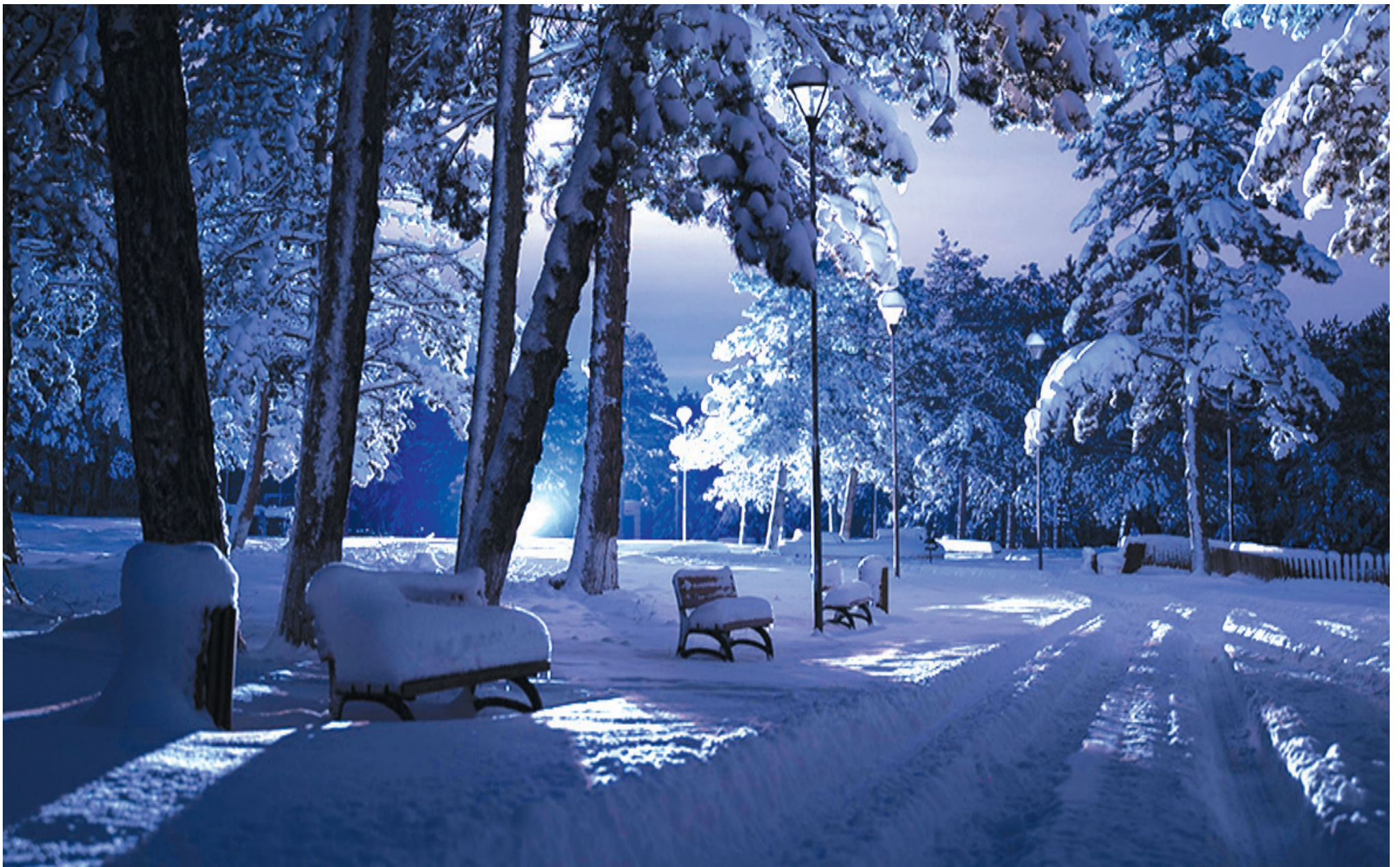
ზამთრის ბოლო დღეებში კიდევ ერთხელ გაბვილამაზა ზემო სერის პარკი.