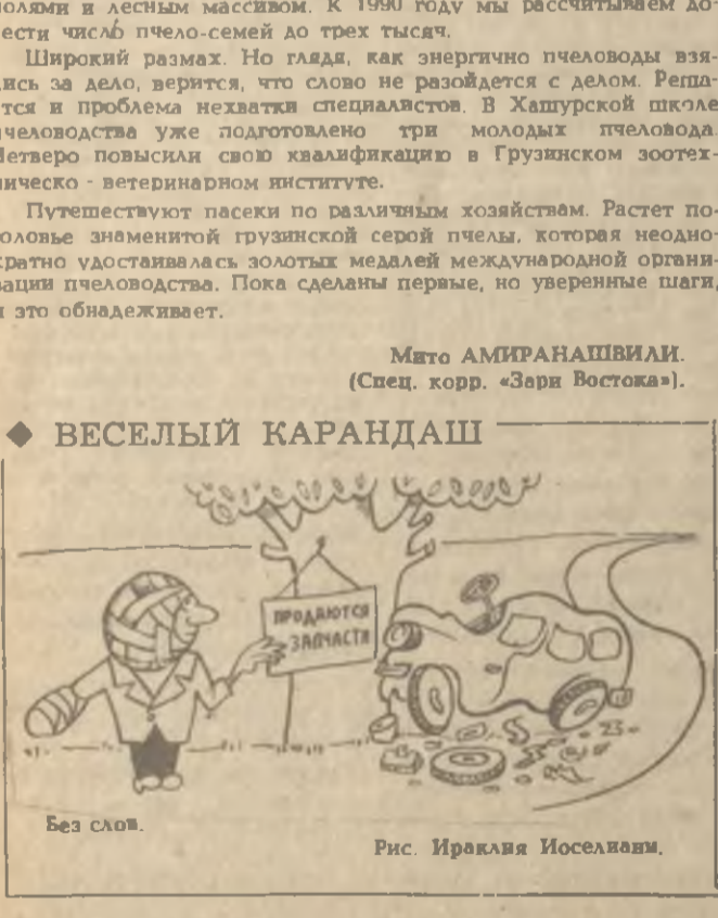
Без слов. Рис. Ираклия Исоселани.