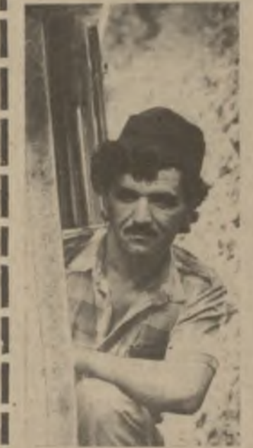
Две трети урожая-86 в Самгорском виноградарском совхозе Гарабаского района состоит из ягод столовых сортов, а всего труженики хозяйства обещают продать государству 600 тонн винограда.