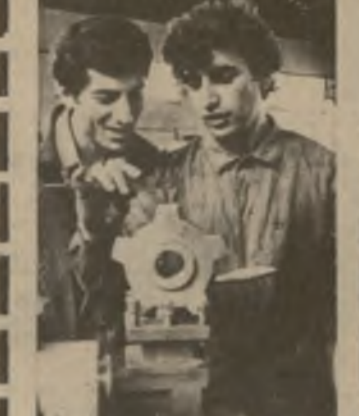
Подготовку работает филиал Батумского машиностроительного завода, открытый в городском райцентре Аджарии Кеда.

Важнейшим условием, определяющим величину получаемой прибыли, является себестоимость строительно-монтажных работ.