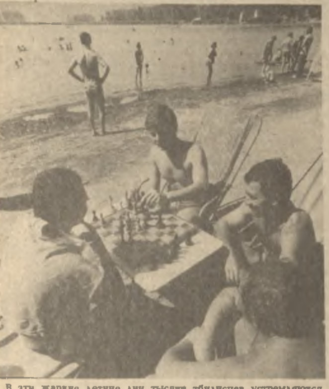
В эти жаркие летние дни тысячи тбилисцев устремляются к воде — озеру Лиси, Тбилискому морю, Череповецкому озеру — туда, где можно поплавать, позагорать, покататься на лодке. На снимке: на пляже озера Лиси.