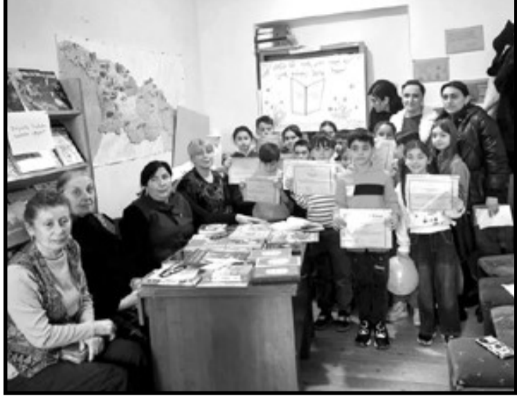
მავალ ბიბლიოთეკებში. ეს დღე ვითარების, შემეცნების, ცოდნის იყო შესწავლა, რომ კითხვა არა მიღებისა და სამყაროს უკეთ მართლ გართობის, არამედ გან- შეცნობის საშუალებაა.

“იკითხე ხმამაღლა, შეცვალე მსოფლიო” – ამ დევიზით წიგნის საჯაროდ კითხვის მსოფლიო დღეს დიდი ინტერესით შეუერთდა მეტეხის სასოფლო ბიბლიოთეკა. მეტეხის საჯარო სკოლის მოსწავლეებმა ხმამაღლა წაიკითხეს სხვადასხვა ნაწარმოებები და ისაუბრეს მათთვის საყვარელი წიგნების შესახებ. ასე აღინიშნა 5 თებერვალი “წიგნის საჯაროდ კითხვის მსოფლიო დღე” კასპის მუნიციპალიტეტის ბიბლიოთეკებისა და მუზეუმების გაერთიანებაში შე-