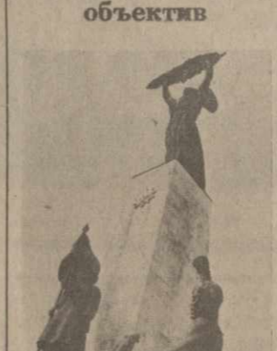
Завтра в ВНР широко отмечается знаменательная дата — 43-я годовщина освобождения столицы республики — Будапешта от немецко-фашистских захватчиков.

На снимке: монумент Освобождения на горе Геллерт в Будапеште, воздвигнутый в честь советских героев, борющихся за свободу и независимость Венгрии.