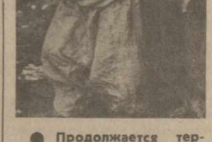
На снимке: этот ливанский ребенок лишился со своими родителями крова в результате очередной диверсии израильской военизированной группы.

Продолжается террор израильских оккупантов на захваченных территориях юга Ливана.