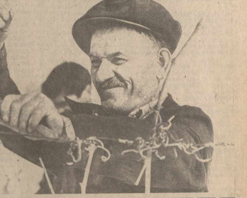
Закон о государственном предприятии — в действии