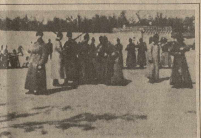
Советский народ торжественно отмечает 70-летие Советских Вооруженных Сил. Он чествует доблестных защитников завоеваний Октября, стоящих на страже созидательного труда, дела мира во всем мире.