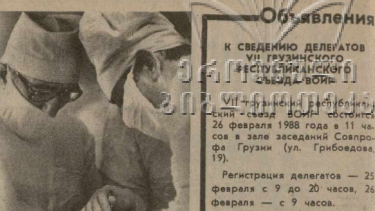
Объявления К СВЕДЕНИЮ ДЕЛЕГАТОВ VII ГРУЗИНСКОГО РЕПУБЛИКАНСКОГО СЪЕЗДА «ВОЕН» VII ГРУЗИНСКИЙ РЕПУБЛИКАНСКИЙ СЪЕЗД «ВОЕН» состоится 26 февраля 1988 года в 11 часов в зале заседаний Совпрофа Грузии (ул. Грибоедова, 19). Регистрация делегатов — 25 февраля с 9 до 20 часов, 26 февраля — с 9 часов. Телефоны для справок: 99-89-21, 93-27-28.