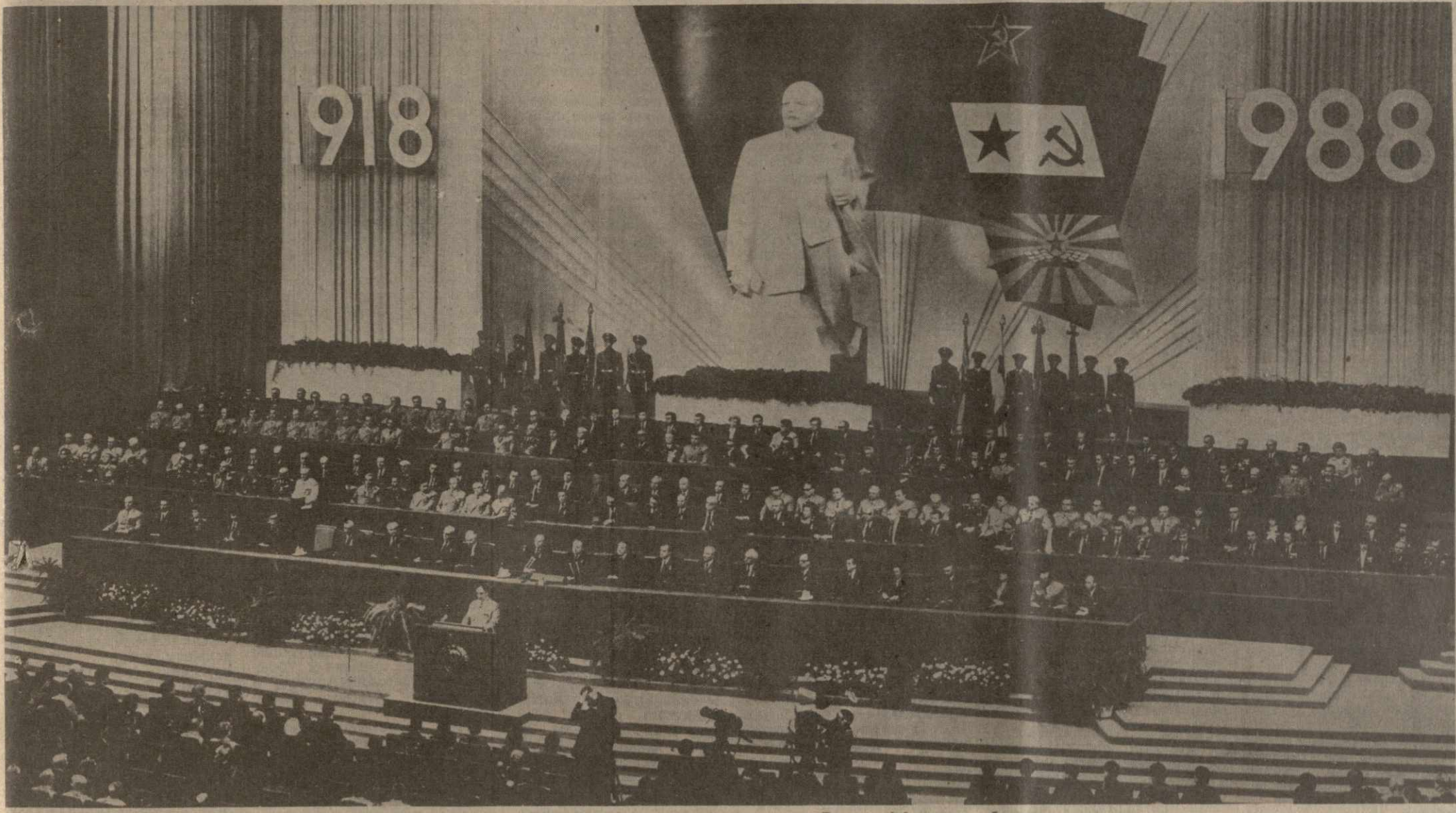
МОСКВА. Торжественное собрание, посвященное 70-летию Советской Армии и Военно-Морского Флота.

№ 45 (19000) ВТОРНИК, 23 ФЕВРАЛЯ 1988 ГОДА ЦЕНА 3 КОП.