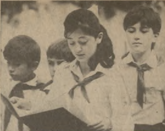
Детский городок «Мзури» гостеприимно встречает пионеров и школьников Тбилиси. Здесь весело и радостно отдыхать. Поэтому не удивительно, что в детском городке почти всегда многолюдно, отовсюду слышны детские голоса, смех. Тут каждый может найти развлечения по душе. Но в городке интересно еще и учиться. К примеру, традиционными стали в «Мзури» уроки мира. В днях четвероклассники тбилисской средней школы № 137 провели урок мира, в котором приняли участие и американским сверстникам, в котором говорится о необходимости мира на Земле, безоблачного неба над нашей планетой. Пусть всегда будет солнце! — скандировали ребята. На снимках: справа — на уроке мира; слева вверху — веселые качели; слева внизу — у входа в городок.