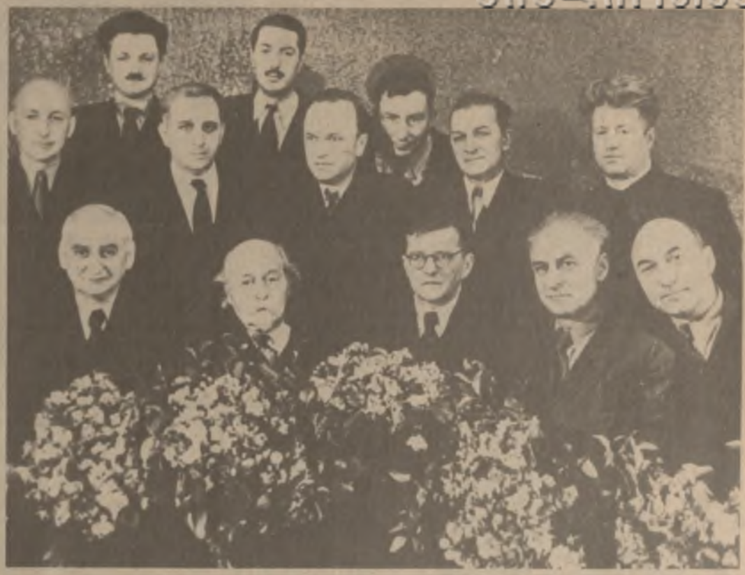
Влияние могучей творческой индивидуальности Шостаковича на грузинскую музыку впервые проявляется в 40-е годы и ощущается во всех жанрах музыкального творчества, в композиционных, стилистических, интонационных особенностях, в отдельных приемах оркестровки. Гравитационное поле Шостаковича по-прежнему весьма сильно, но его «флюиды», конечно же, преломляются через призму творческой индивидуальности наших композиторов, адаптируются в художественной среде грузинского музыкального стиля.

Сегодня, 25 сентября, исполняется 80 лет со дня рождения великого советского композитора, одного из крупнейших творцов XX столетия Дмитрия Дмитриевича Шостаковича. Дату эту отмечают все передовое человечество, мировая музыкальная общественность. Его великие творения вошли в сокровищницу мировой музыкальной культуры, а создание миллионов людей всех стран и континентов. Произведения Шостаковича — это и правдивая, волнующая летопись нашего времени, и пронзительно искренняя исповедь Творца и Человека. Начиная с 1926 года, когда 19-летним юношей Д. Шостакович заявил о себе всему музыкальному миру своей замечательной Первой симфонией, и кончая последним сочинением — сонатой для альта и фортепиано, написанной незадолго до смерти, творчество его неизменно вызвало горячий интерес, возбудило мысли и чувства философской глубины проблематики, высочайшим эстетическим качеством, необычайной искренностью и, можно сказать, выстраданностью своего художественного содержания.