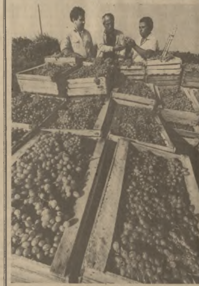
В Храбском виноградарском совхозе Марнеульского района — стелли. Уже собрано более 200 тонн янтарных гроздей. Всего же за сезон государство будет продана тысяча тонн винограда столовых сортов.

«Добились ли мы этого?» — спросил секретарь парторганизации. Сам и ответил: Пока нет. С нарушениями ведется севооборот, в производство не внедряются новые перспективные сорта сельскохозяйственных культур, нет должной заботы о пастбищах. То есть конкретные люди — будь то главный специалист или рабочий — не выполняют пока как следует своих обязанностей. И наша вина,