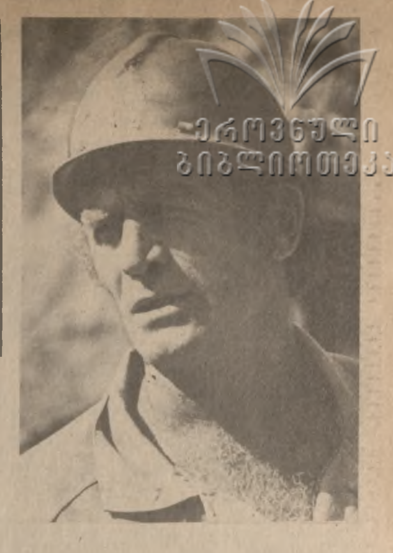
მ. ს. გორბაჩევი

ზარია ვოსტოკა საბჭოთაო კავშირის საბჭოთაო კავშირის საბჭოთაო კავშირის საბჭოთაო კავშირის