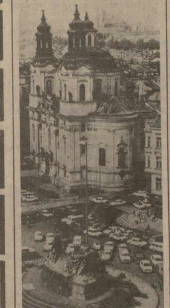
Чехословакия. Уголки Староместской площади в Праге. Сорок лет назад на Староместской площади сто тысяч трудящихся слушали выступление Клемента Готвальда, призвавшего весь народ к борьбе против реакции. Эта площадь была и остается местом народных торжеств и собраний. В центре ее установлен памятник вождю освободительного движения чехословацкого народа великому Яну Гусу.