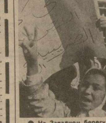
На Западном берегу реки Иордан и в секторе Газа происходят ожесточенные столкновения палестинского населения с израильскими карателями.

На снимке: очередь из автофургонов, образовавшаяся в результате забастовки паромщиков, в порту Дувера.