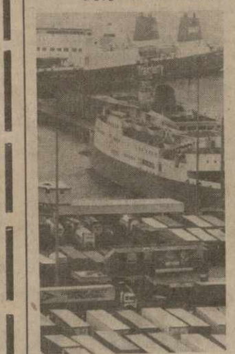
Великобританию охватил новая волна забастовок.

Чехословакия. Уголки Староместской площади в Праге. Сорок лет назад на Староместской площади сто тысяч трудящихся слушали выступление Клемента Готвальда, призвавшего весь народ к борьбе против реакции. Эта площадь была и остается местом народных торжеств и собраний. В центре ее установлен памятник вождю освободительного движения чехословацкого народа великому Яну Гусу.