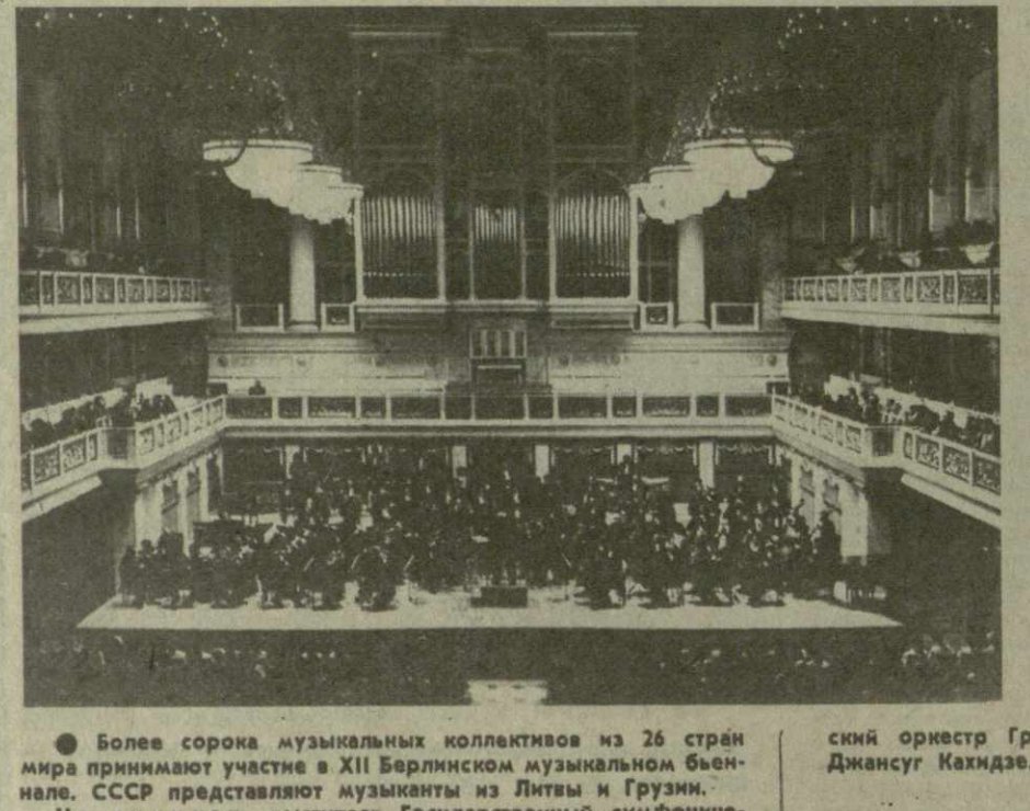
Более сорока музыкальных коллективов из 26 стран мира принимают участие в XII Берлинском музыкальном фестивале. СССР представляет музыканты из Литвы и Грузии. На снимках: выступает Государственный симфонический оркестр Грузии; дирижирует народный артист СССР Джансуг Кахидзе.

В 1931 году он организует восхождение по совершенно новому пути на вершину Казбека. В 1933 — руководит комплексной экспедицией Грузинского географического общества на Центральный Кавказ, где проводились топографические, геологические, ботанические и метеорологические исследования бассейнов и Танберского ледников. Тогда же