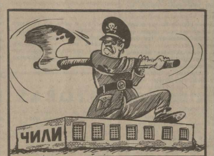
Рис. Тенгиза Гиголова.

В настоящее время в Чили 442 человека арестованы по политическим мотивам. Из них тринадцать приговорены к смертной казни.