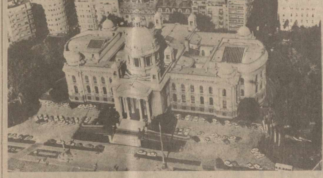
Современный Белград — столица социалистической Югославии — политический, экономический и культурный центр страны. На снимке: здание высшего органа государственной власти — Скупщины СФРЮ — на бульваре Революции.