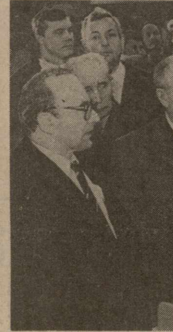
Посещение производственного объединения «Иво Лола Рибар» и беседа с представителями органов самоуправления, администрации и общественно-политических организаций.

После осмотра цеха по производству станков с числовым программным управлением, обрабатывающих центров, промышленных роботов состоялся встреча с представителями органов самоуправления, администрации и общественно-политических организаций объединения.