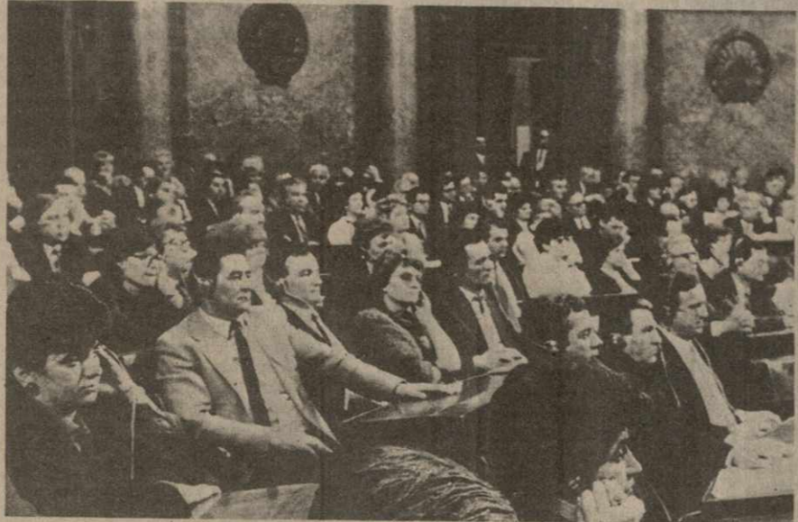
Во время выступления М. С. Горбачева в Скупщине СФРЮ

Республики Словении Франце Полит, Председатель ЦК Союза коммунистов Словении Милан Кучан с супругами, другие официальные лица.