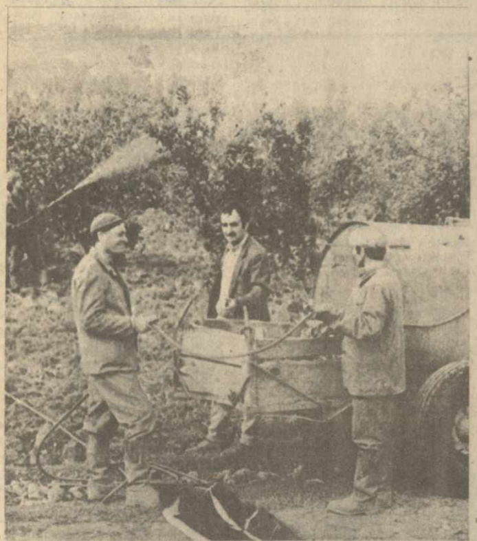
Горячая пора сейчас у аджарских цитрусоводов, которые поставили перед собой цель — вырастить в третьем году пятилетки добрый урожай. На снимке: на плантации колхоза села Хелвачаури идет опрыскивание деревьев.

в нынешнем году работать за счет сэкономленных ресурсов, а том числе в день открытия конференции. Моряки намерены путем совершенствования технического обслуживания флота, ускорения его ремонта увеличить эксплуатационный период сухогрузов до 334,5 дня, а танкеров — до 330,5 дня. В портах пароходства годовой план переработки народнохозяйственных грузов намечено выполнить к 25 декабря, а полугодовое задание — ко дню открытия XIX партконференции. Роман МАЛХАЗИШВИЛИ, (Спец. корр. «Зари Востока»).