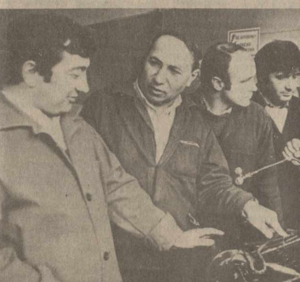
На снимках сверху — работники жилищно-коммунального хозяйства и бытового обслуживания населения.