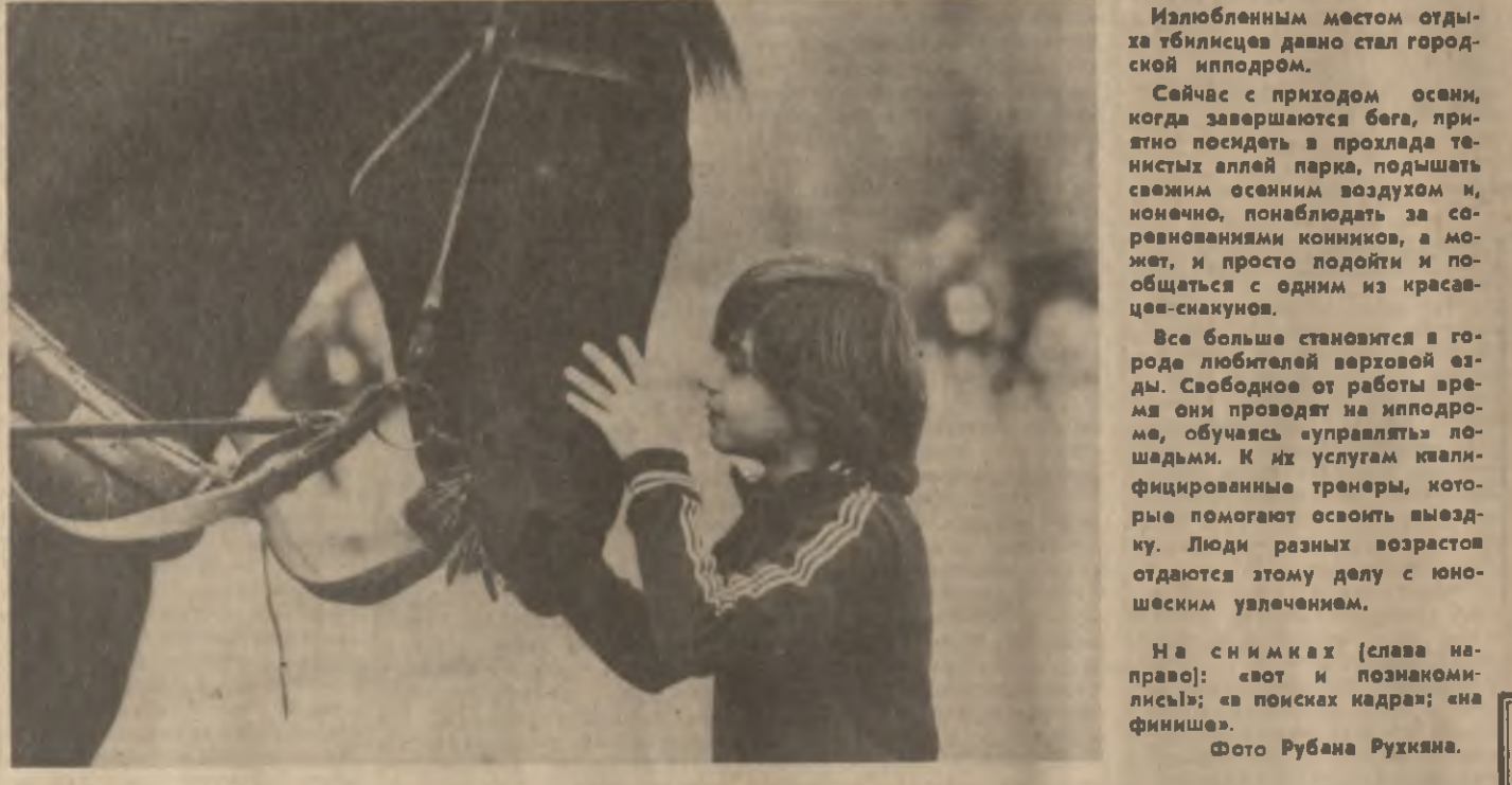
Излюбленным местом отдыха тбилисцев давно стал городской ипподром. Сейчас с приходом осени, когда заканчивается лето, приятно посидеть в прохладе тенистых аллей парка, подышать свежим осенним воздухом и, нежно, понаблюдать за соревнованиями конников.