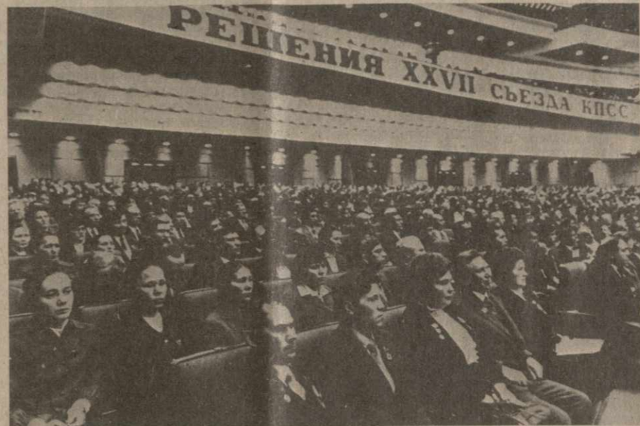
На снимке: во время выступления Генерального секретаря ЦК КПСС М. С. Горбачева.