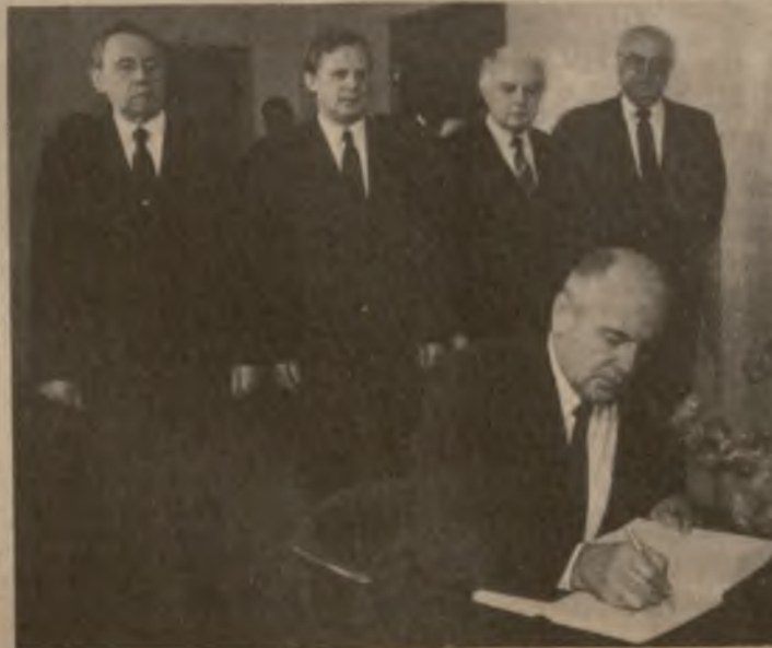
Руководители Коммунистической партии и Советского государства в посольстве НРМ.

23 октября товарищи Горбачев М. С., Громыко А. А., Рыжков Н. И., Шеварднадзе Э. А., Добрынин А. Ф. посетили посольство Народной Республики Мозамбик в СССР в связи с трагической гибелью Председателя Партии Фрелимо, президента РМ маршала Саморы Мойзеса Машела.