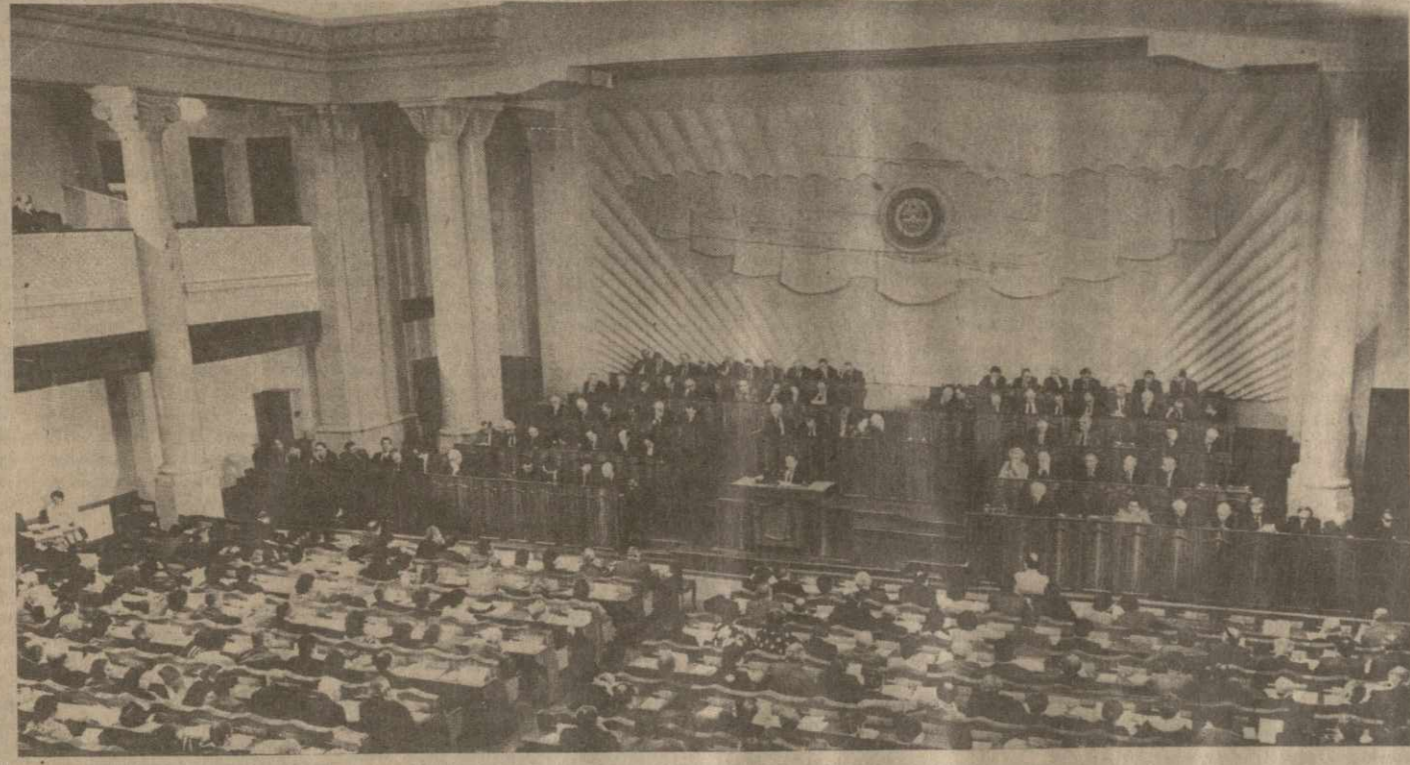
Тбилиси, 2 апреля 1988 года. В зале заседаний восьмой сессии Верховного Совета Грузинской ССР одиннадцатого созыва.

Собравшиеся аства и ем почтили память депутата Верховного Совета Грузинской