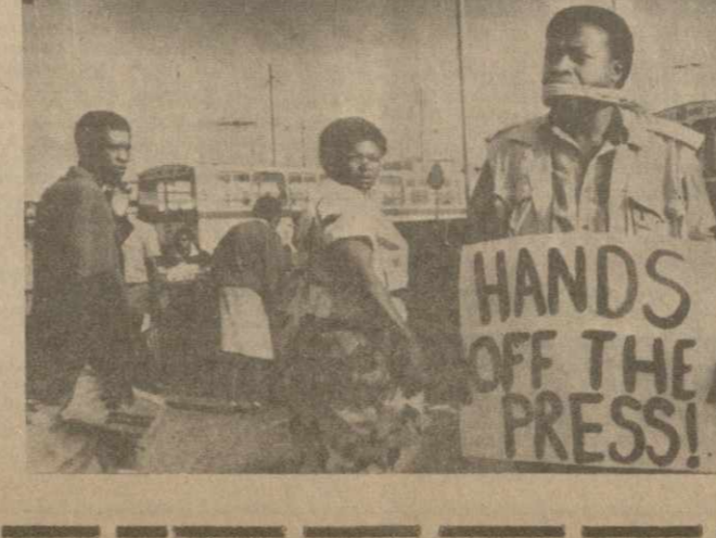
На снимке: во время демонстрации.

В. АСАТИАНИ, министр культуры Грузинской ССР. (ГРУЗИНФОРМ).