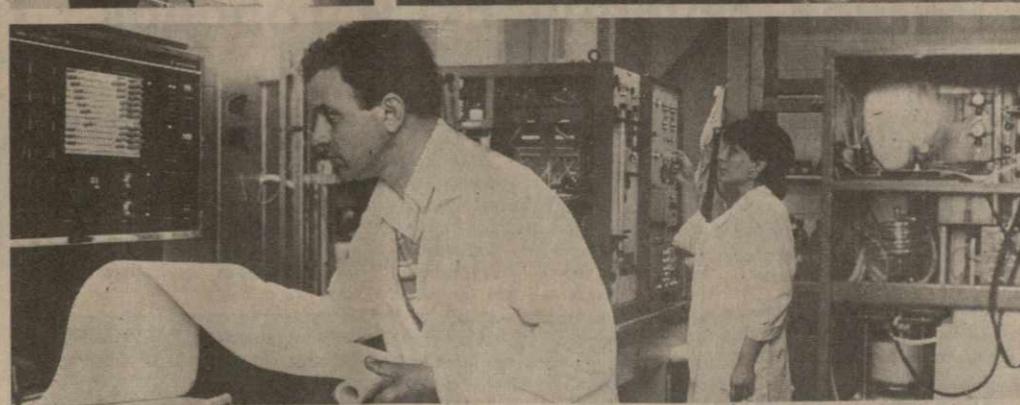
Коллектив Института биохимии растений АН Грузии на договорных началах сотрудничает с крупнейшими научными центрами страны, имеет немало зарубежных партнеров...