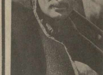
На летние пастбища перебрались отары овец колхоза имени Орджоникидзе села Бодбе Сигахского района. В них сейчас насчитывается без малого 17.800 голов, в том числе свыше 7.600 овцематок.

На сибирке среди лучших чабанов хозяйства названы из четвертой овцеводческой бригады.