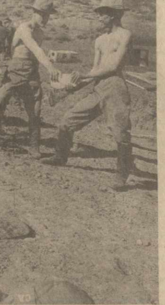
Студенты и воины — на субботнике по восстановлению памятника истории Давидгареджа.