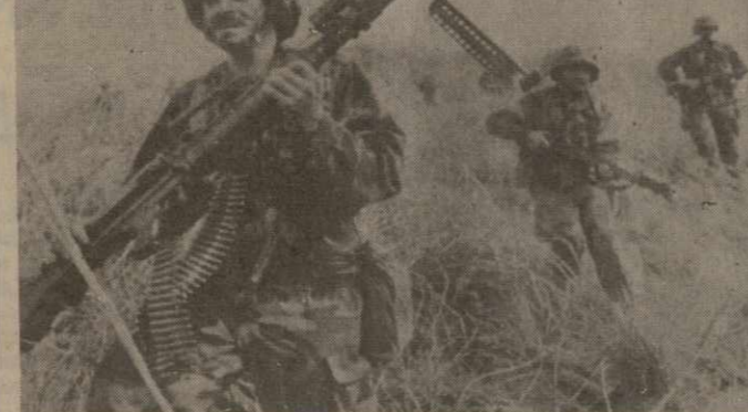
Соединенные Штаты наращивают военный и экономический нажим на Панаму. В страну постоянно перебрасываются все новые воинские подразделения и военная техника. На днях в Панаму началась переброска дополнительного контингента американских войск в составе 1.300 солдат, которые направлены туда под предлогом «защиты американских граждан». Наращивание военного присутствия США в зоне канала осуществляется параллельно с проведением в районе широкомасштабных американских военных маневров.

ТОКИО. Министерство внешней торговли и промышленности Японии объявило о своем намерении приступить к разработке «космического робота», предназначенного для ремонтных и сборочных работ на орбите. Этот робот высотой два метра и весом около 500 килограммов будет подходить к человеку не только своим внешним видом — он будет осначен искусственным интеллектом.