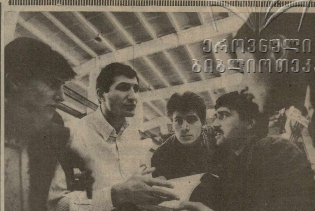
● Продукция Тбилисского научно-производственного объединения «Аналитрибор» отгружается во все регионы страны и за рубеж.

Разрабатываемые здесь приборы производятся на Украине, в Белоруссии, Армении, Азербайджане.