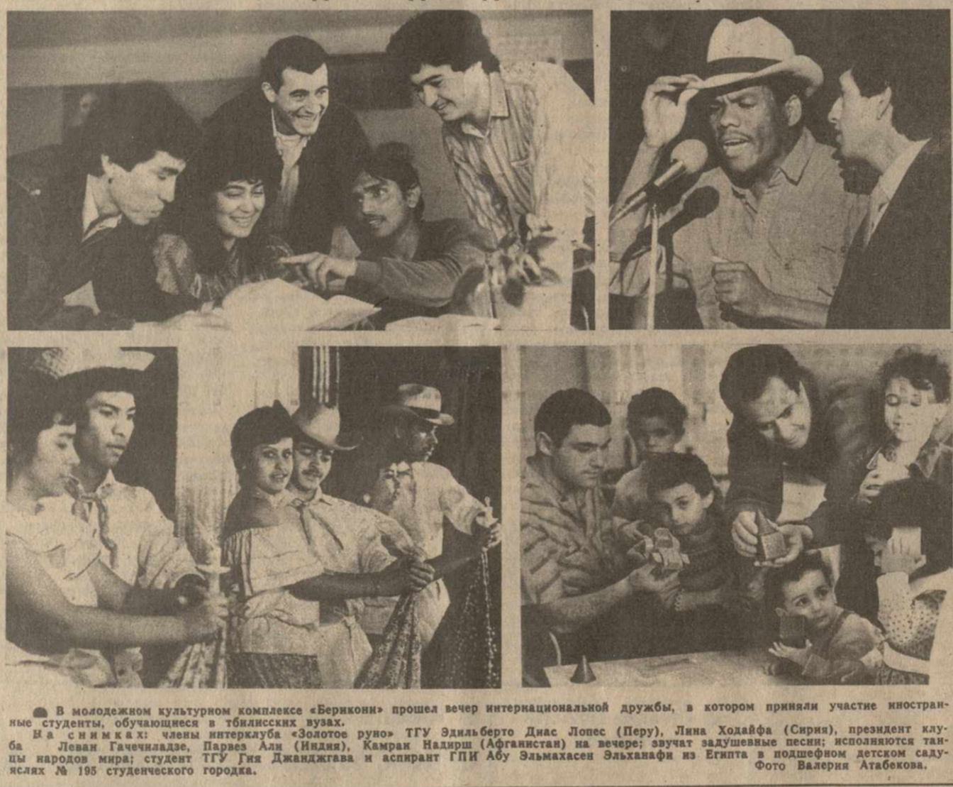
В молодежном культурном комплексе «Беркови» прошел вечер интернациональной дружбы, в котором приняли участие иностранные студенты, обучающиеся в тбилисских вузах.