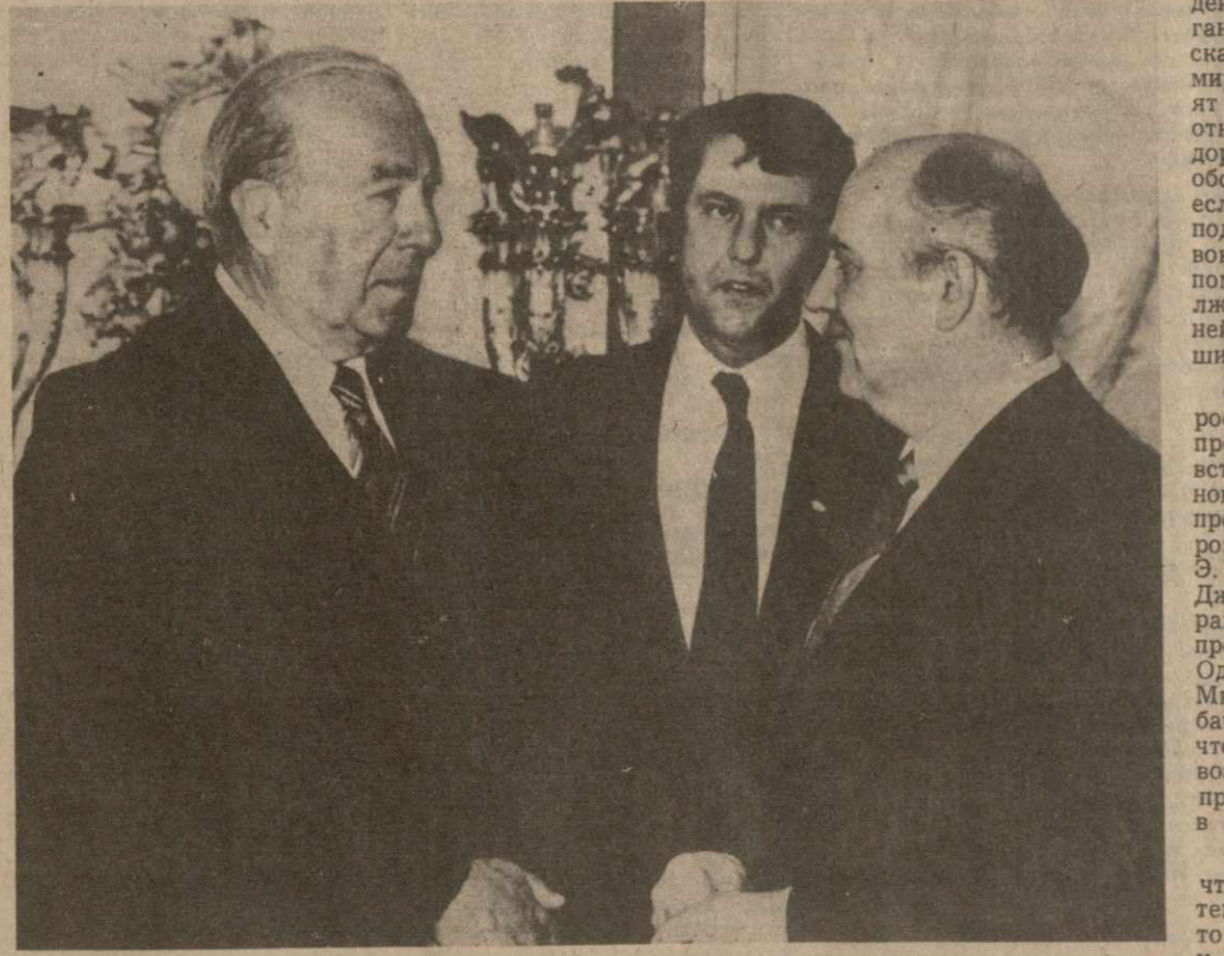
На снимке: перед началом беседы.

Тогда, чьи же интересы отражают официальные вы- ступления, рассчитанные на принципиальные уступки со стороны СССР и по существу оправдывающие гонку вооружений? И не отсюда ли торжожение, признаки которого и дело приходи- тся наблюдать в ходе ве- дущихся переговоров, в том числе связанных с визитом Р. Рейгана в Москву? И неужели предстоящий визит президента США в СССР после 15-летнего пе- рерыва и после уже трех встреч с нынешним совет- ским руководством будет сведен к тому, чтобы опять заниматься «по ли трамо- вы» — объяснениями насчет существующих реальностей, с которыми опасно не счита- ться. Сегодня, продолжал М. С. Горбачев, узкий пра-